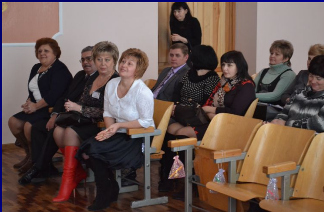
Заступників начальників районних відділів освіти