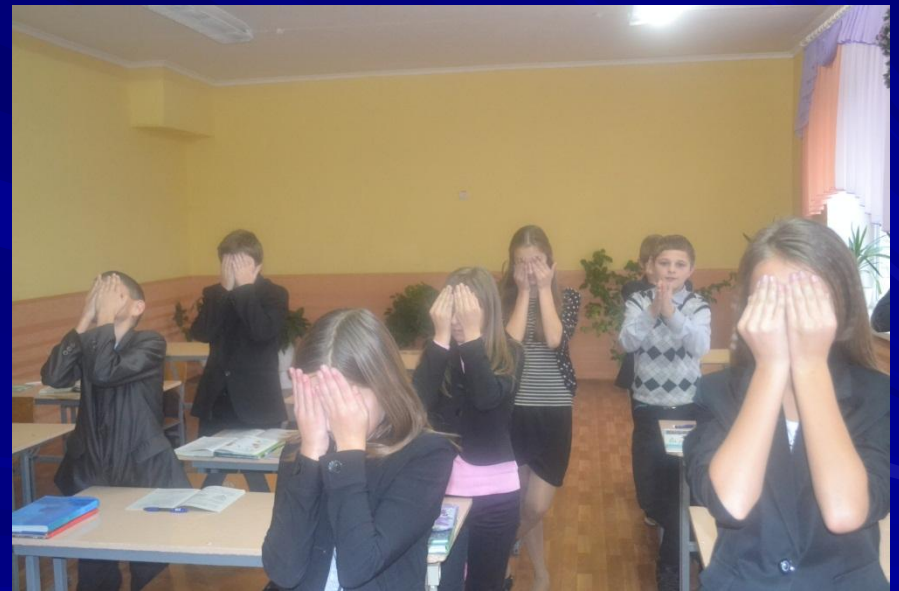
Гімнастика для очей. Пальмінг