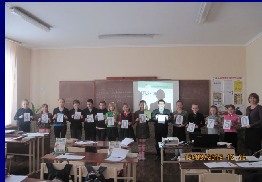
Фізкультхвилинка на уроці математики