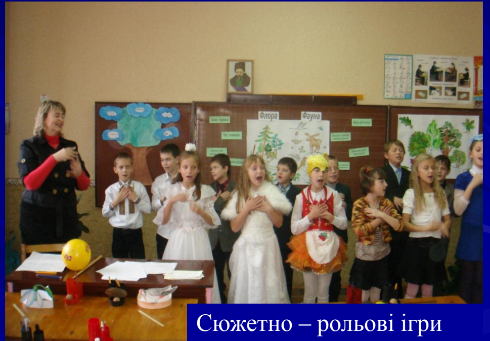
Сюжетно – рольові ігри Дахнюк Г.І.