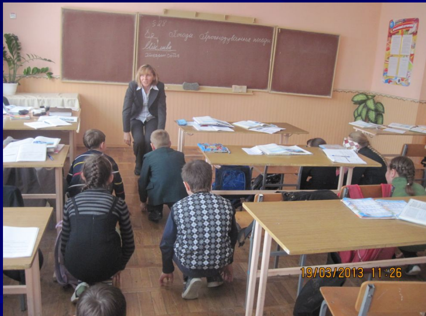
Формування поведінки на уроці природознавства