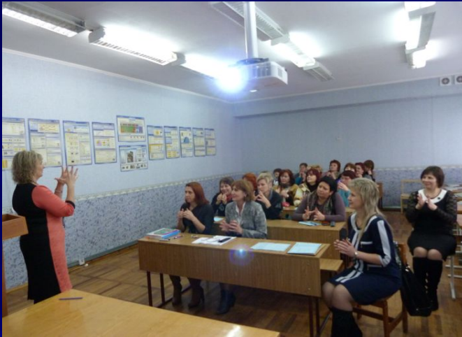
Вчителів російської мови