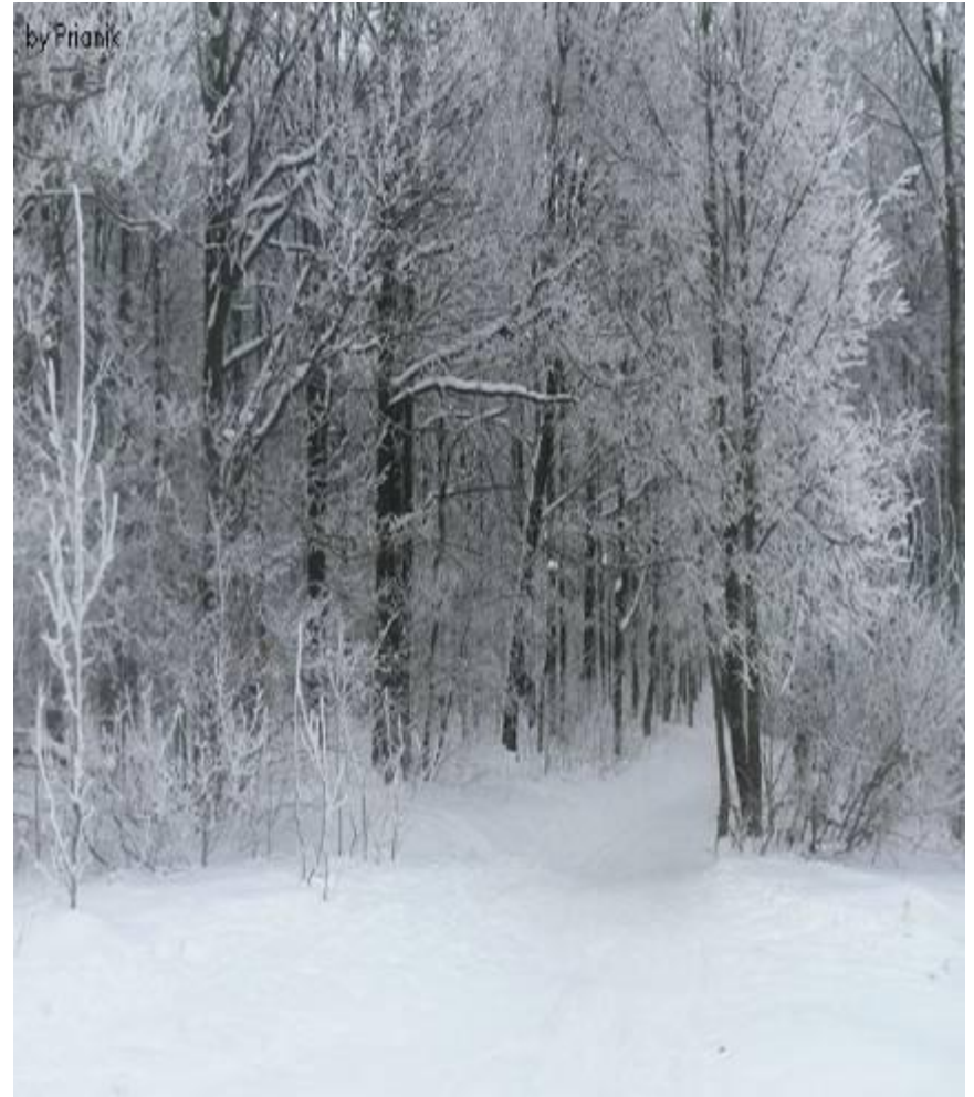
Смешанные и широколиственные леса зимой