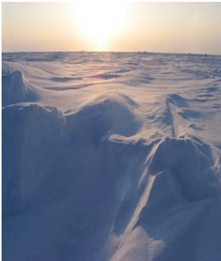
АРКТИЧЕСКАЯ ПУСТЫНЯ ЗИМОЙ