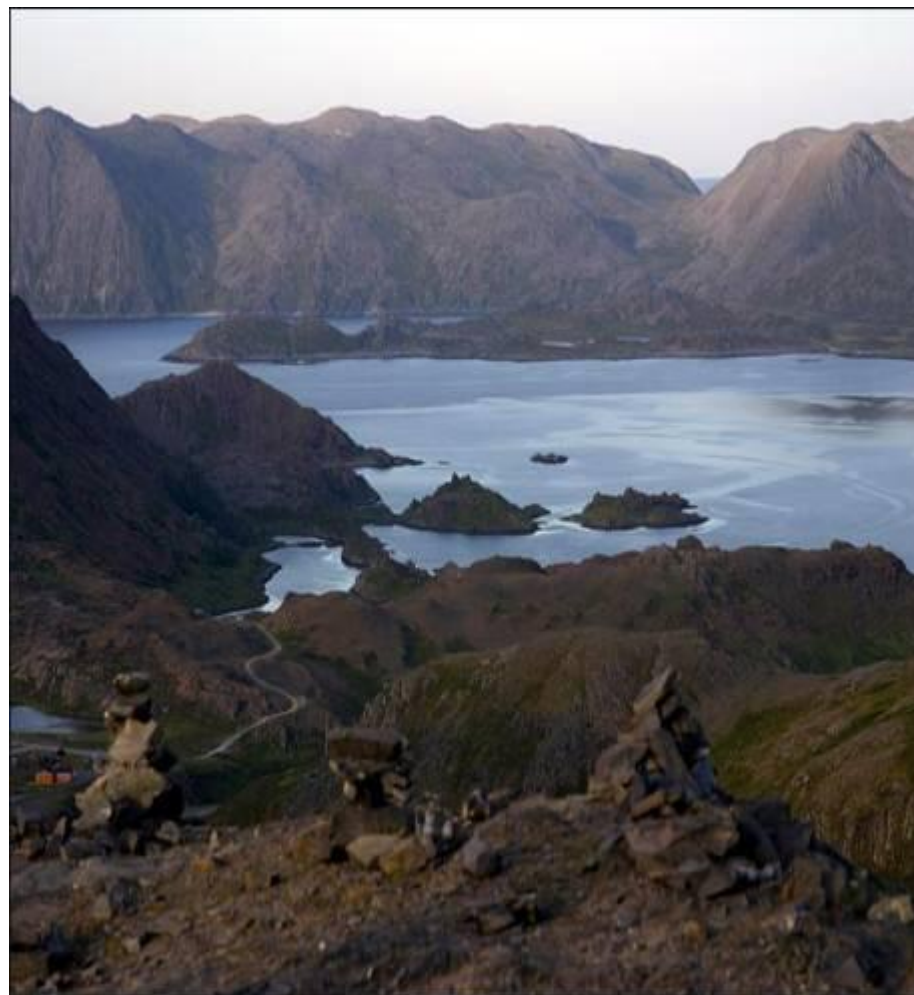
АРКТИЧЕСКАЯ ПУСТЫНЯ ЛЕТОМ