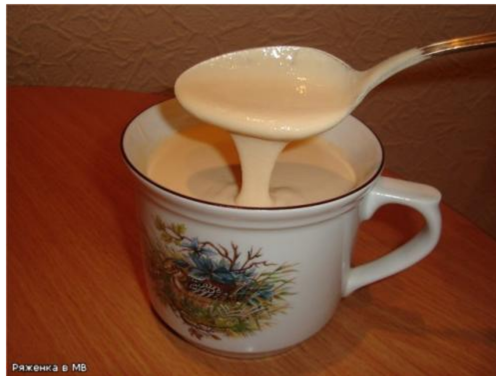
Ряженка в МВ