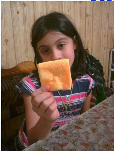
Скрепляем салфетку степлером