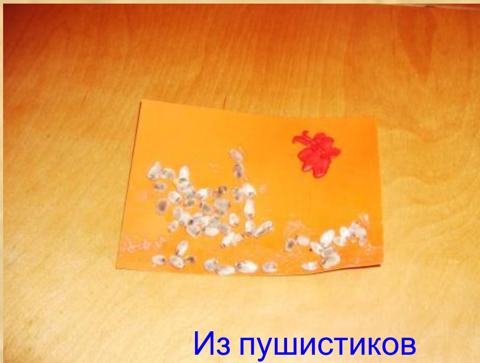
Из пушистиков получилась собачка