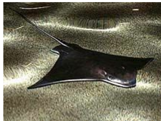
Водные организмы также имеют разную форму, в зависимости от образа жизни