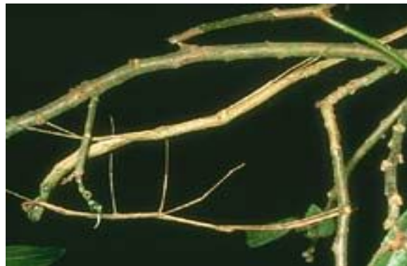
палочник - ветку, сухой лист.