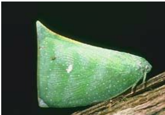
Горбатка напоминает шип;