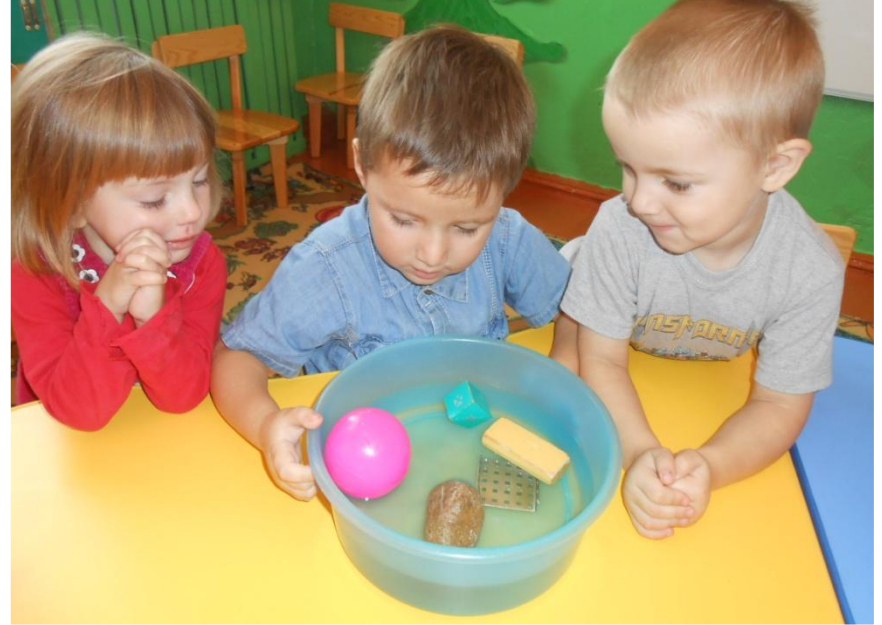
Игра-эксперимент "Тонет - не тонет"