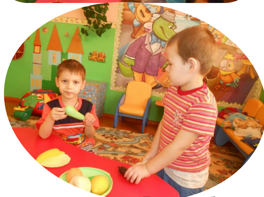
Сюжетно-ролевая игра "Готовим обед" расширить знания детей о значении воды в жизни человека