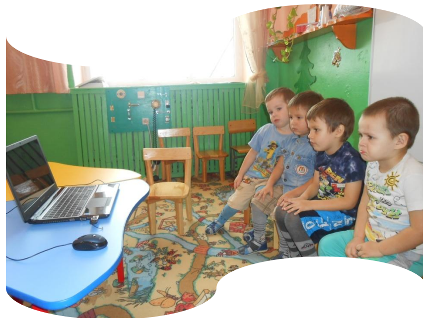
Сказка про Капельку