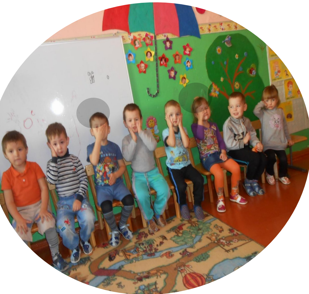
Физминутка "Льется чистая водичка"