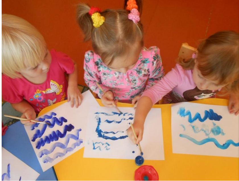
Рисование "Волны на