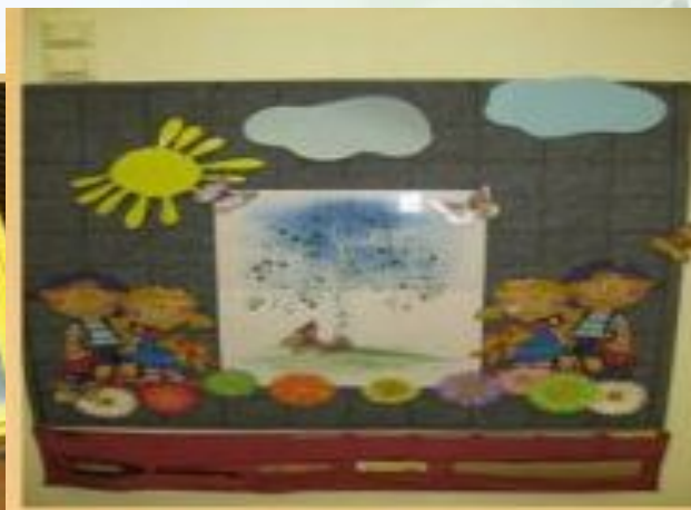
«мой город» (отрывок)