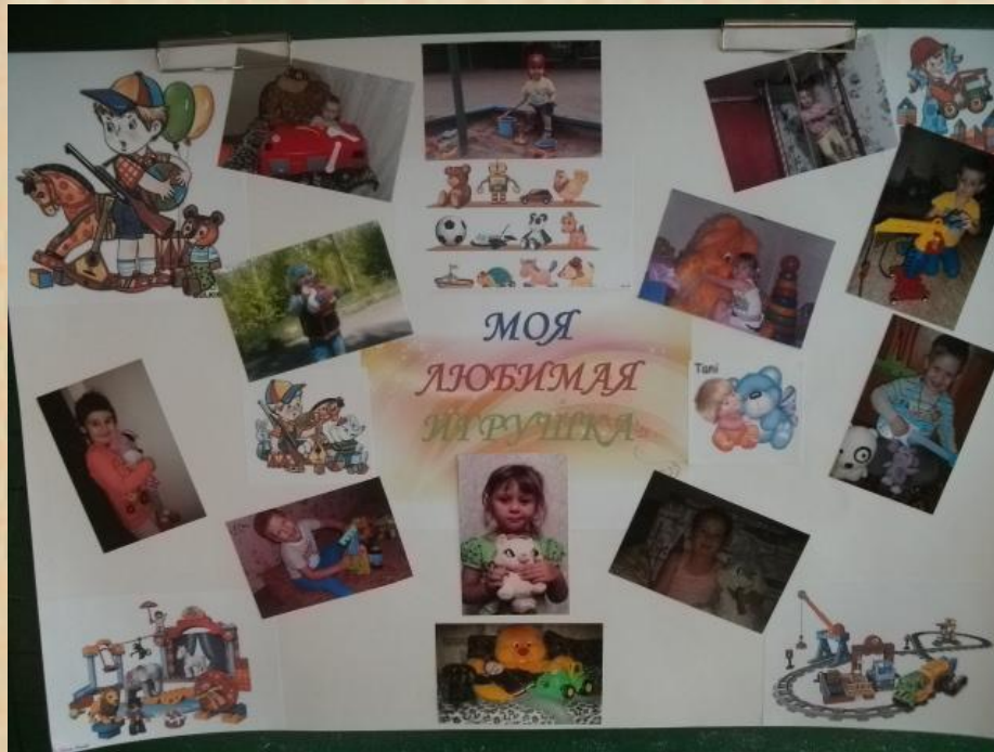
Фото выставка «Моя любимая игрушка»