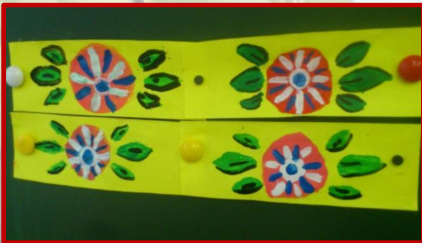
«Узор» (хохлоมская роспись)