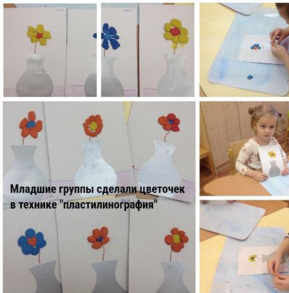
Младшие группы сделали цветочек в технике "пластилинография"