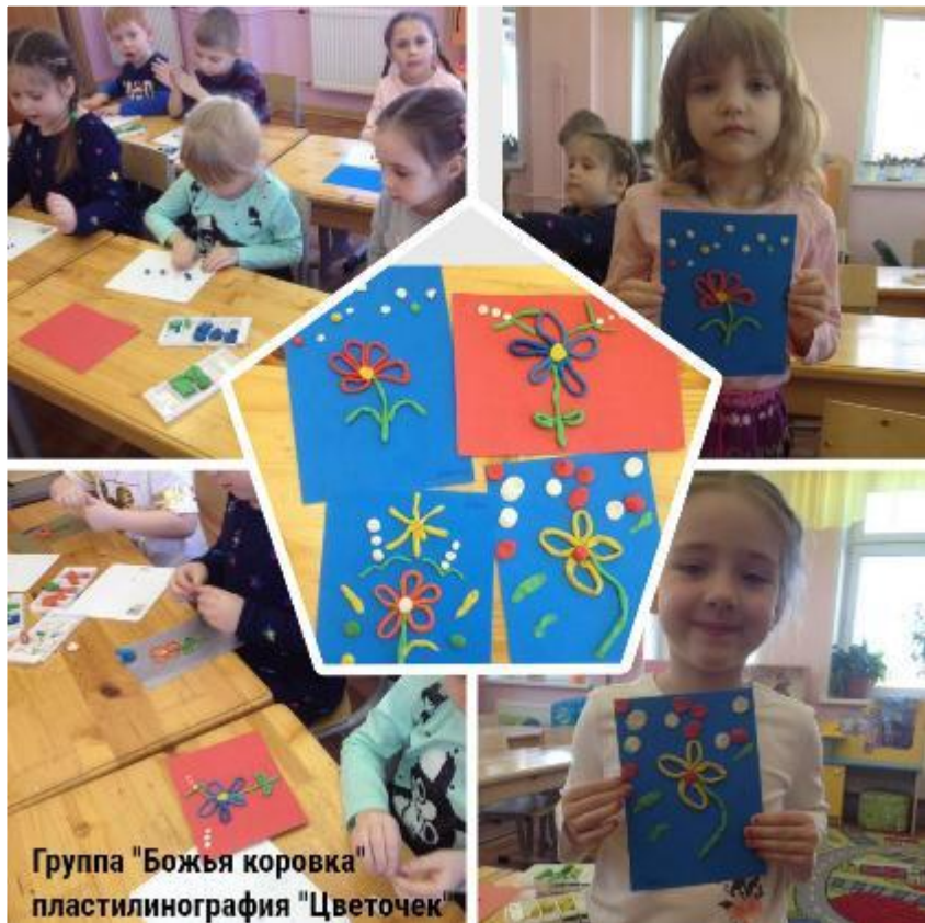
Группа "Божья коровка" пластилинография "Цветочек"