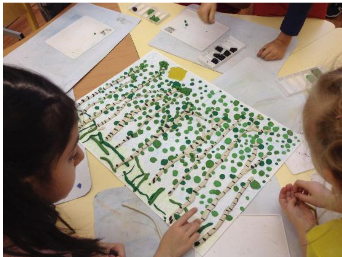
Коллективная работа «Русские берёзки» Подготовительная группа