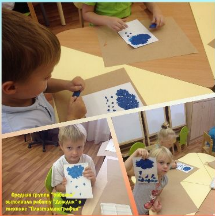
Средняя группа «Бережок» выполнила работу «Дождик» в технике «Пластилинография»