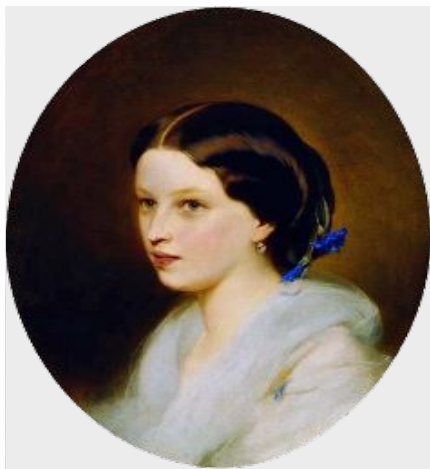
Старшая дочь А.С. Пушкина