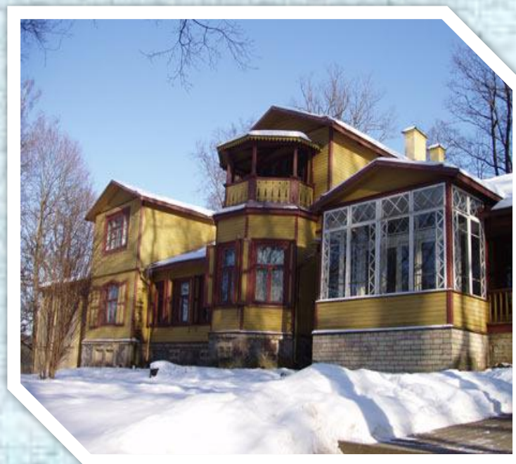
Дом-усадьба Пушкиных в Маркучай