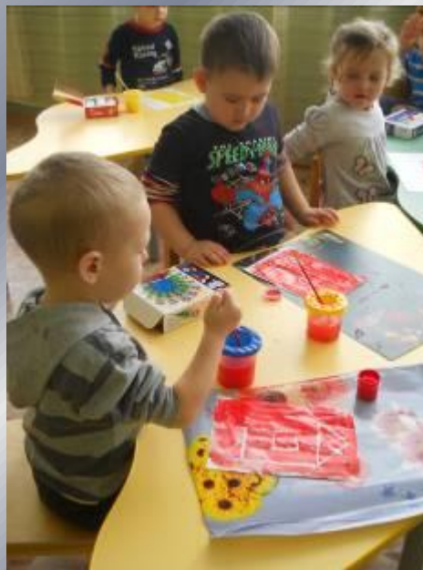
рисование по воску