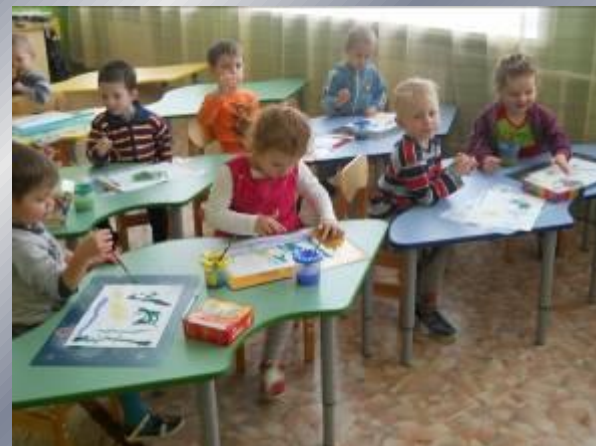
тычок жёсткой полусухой кистью