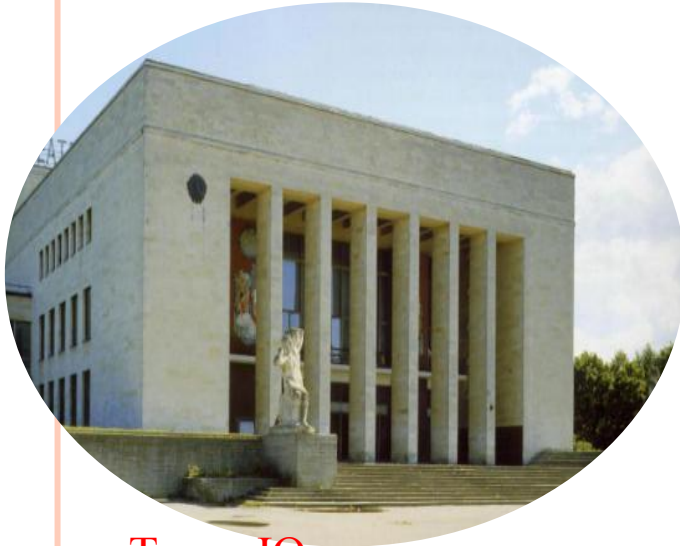
Театр Юного зрителя