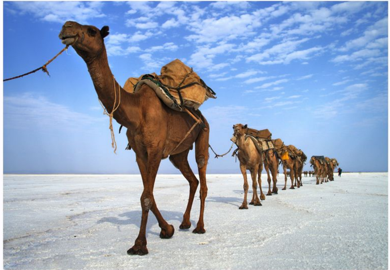
Ethiopia 2009 - Lac Karoun

В Древнем Риме караваны с солью медленно брели по главной торговой дороге - виа Солариа, что означало «Соляной путь».