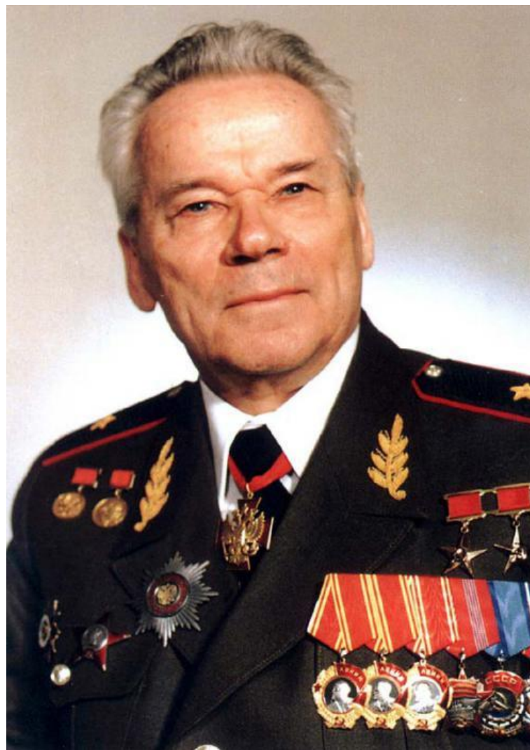
Михаил Тимофеевич Калашников