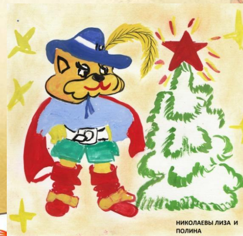
НИКОЛАЕВЫ ЛИЗА И ПОЛИНА