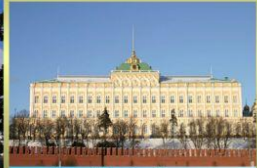
Большой Кремлёвский дворец