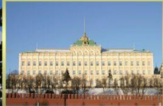
Большой Кремлёвский дворец