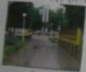
Моя родная станция - это главный вход в город