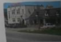
Станция и кафе «Солнечный»