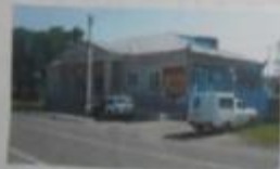
Аптека, аптека Кудачки