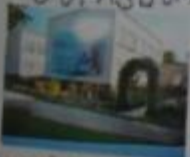
Светлый кафе №10