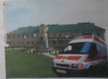
Красноярский региональный дом.