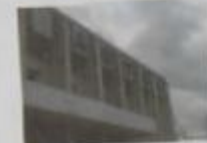
«Гостиница и кафе»