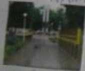
Моя родная станция главный вход всегда открыт