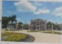
Администрация Туапсинского городского поселения