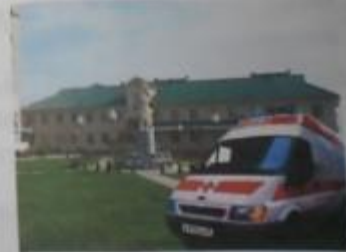
Красноярский районный госпиталь