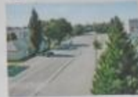
ул. Красная в центре Туапсе