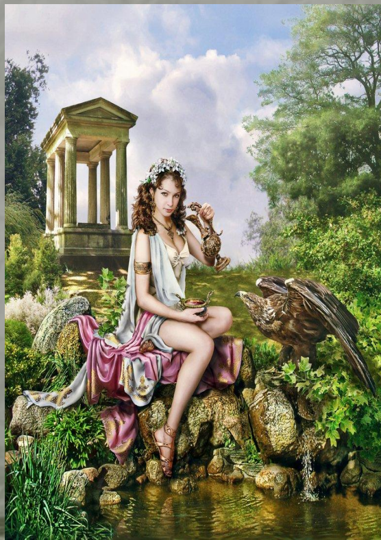
Г е р а