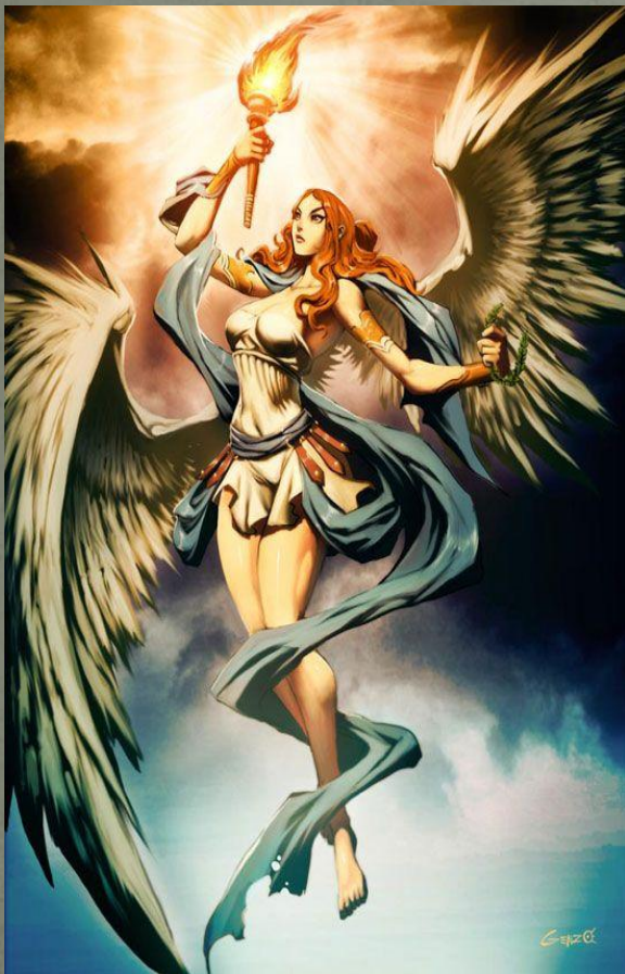
Ника –богиня победы

Царь Зевс сидит на высоком золотом троне.. У трона его стоит богиня мира Эйрена и постоянная спутница Зевса крылатая богиня победы Ника.