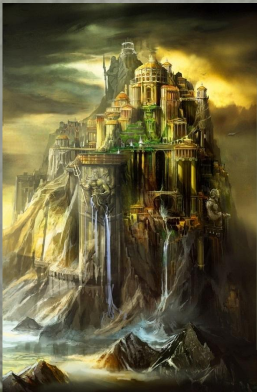
О Л И М П

На Олимпе всегда царит мир и покой. Никогда здесь не бывает зимы и морозов. Золотое сияние днем и ночью разливается вокруг. В роскошных золотых дворцах, который построил Гефест, живут здесь бессмертные боги. Пируют и веселятся они в своих золотых чертогах. Но и о делах не забывают, ведь у каждого из них есть свои обязанности.