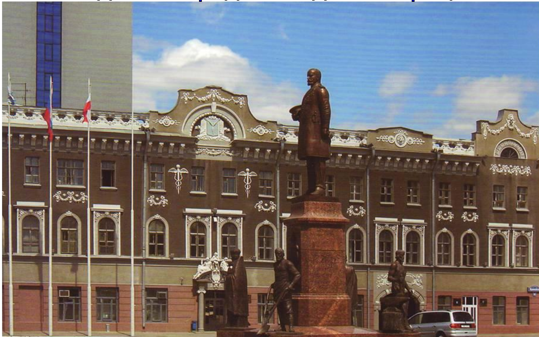
Памятник П.А. Столыпину