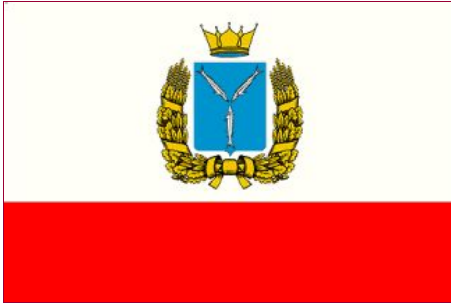
Флаг Саратовской области