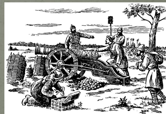
Рис. 12. Русская бронзовая „гафуница“ XVII века