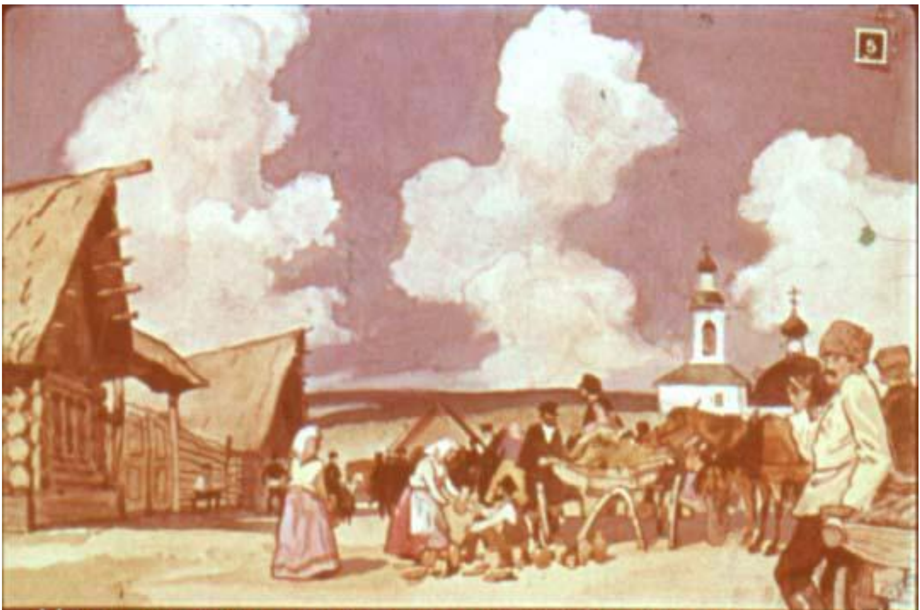
На площади стояли возы, горшечник расхваливал свой товар, девчата гуляли в ярких праздничных юбках.