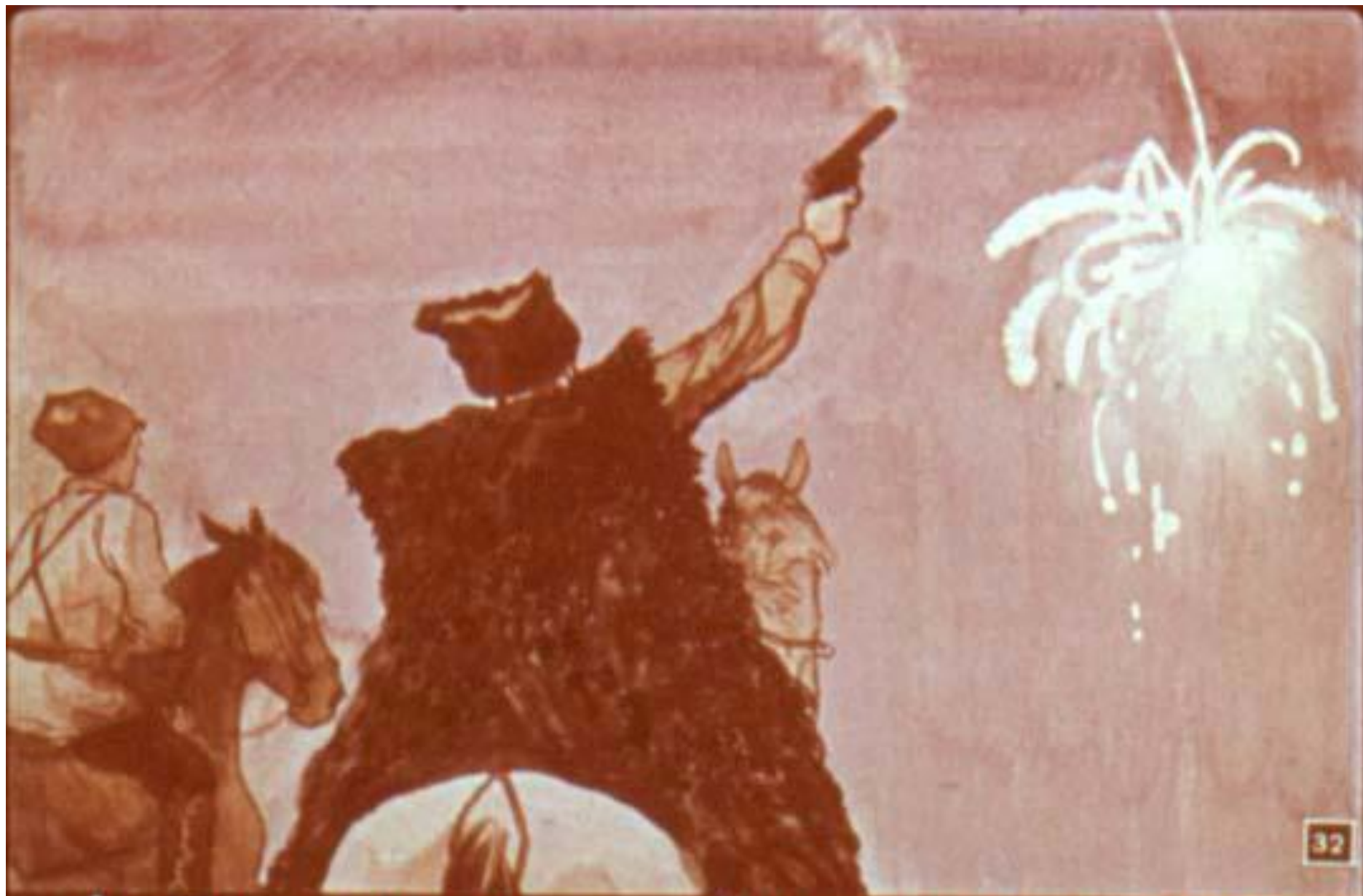
А чапаевцы подъехали к Нлинцовке с другой стороны. Чапаев выстрелил, пустил ракету.