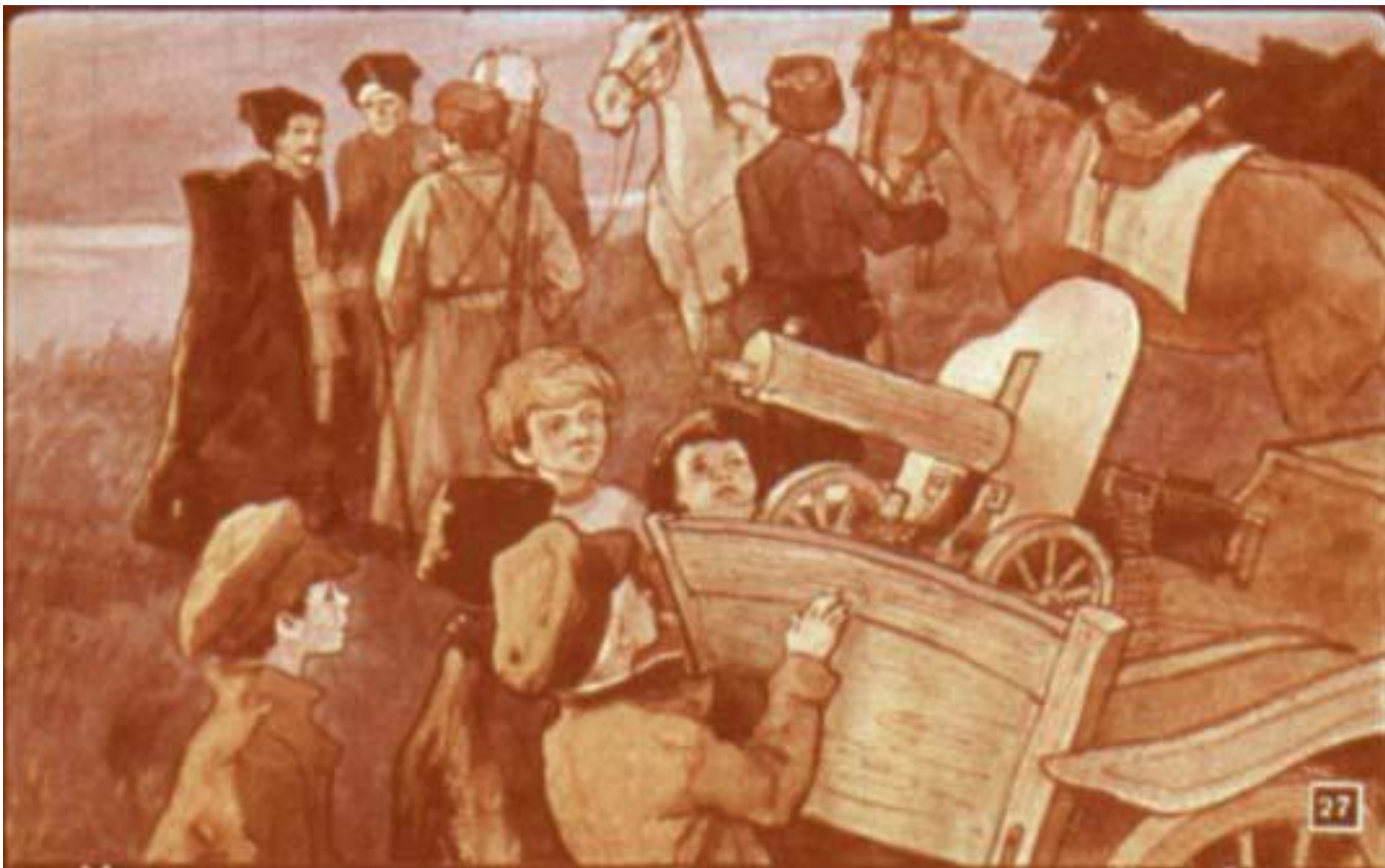
Чапаевцы сошли с коней, стали совещаться. А ребята, как увидели пулемёт, так обо всём забыли, столпились у тачанки.