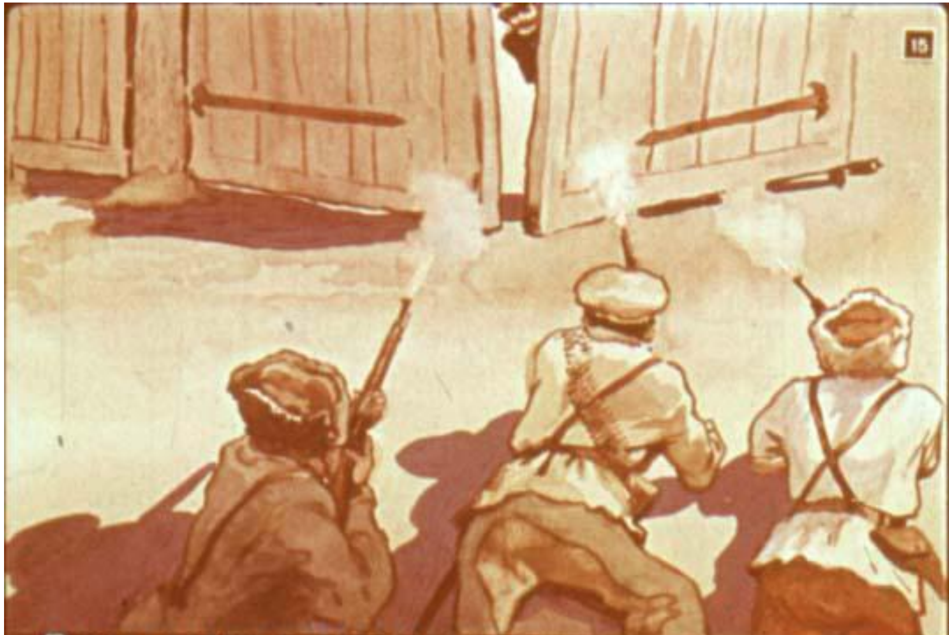
В это время в ворота просунулась чья-то голова. Чапаевцы дали залп.