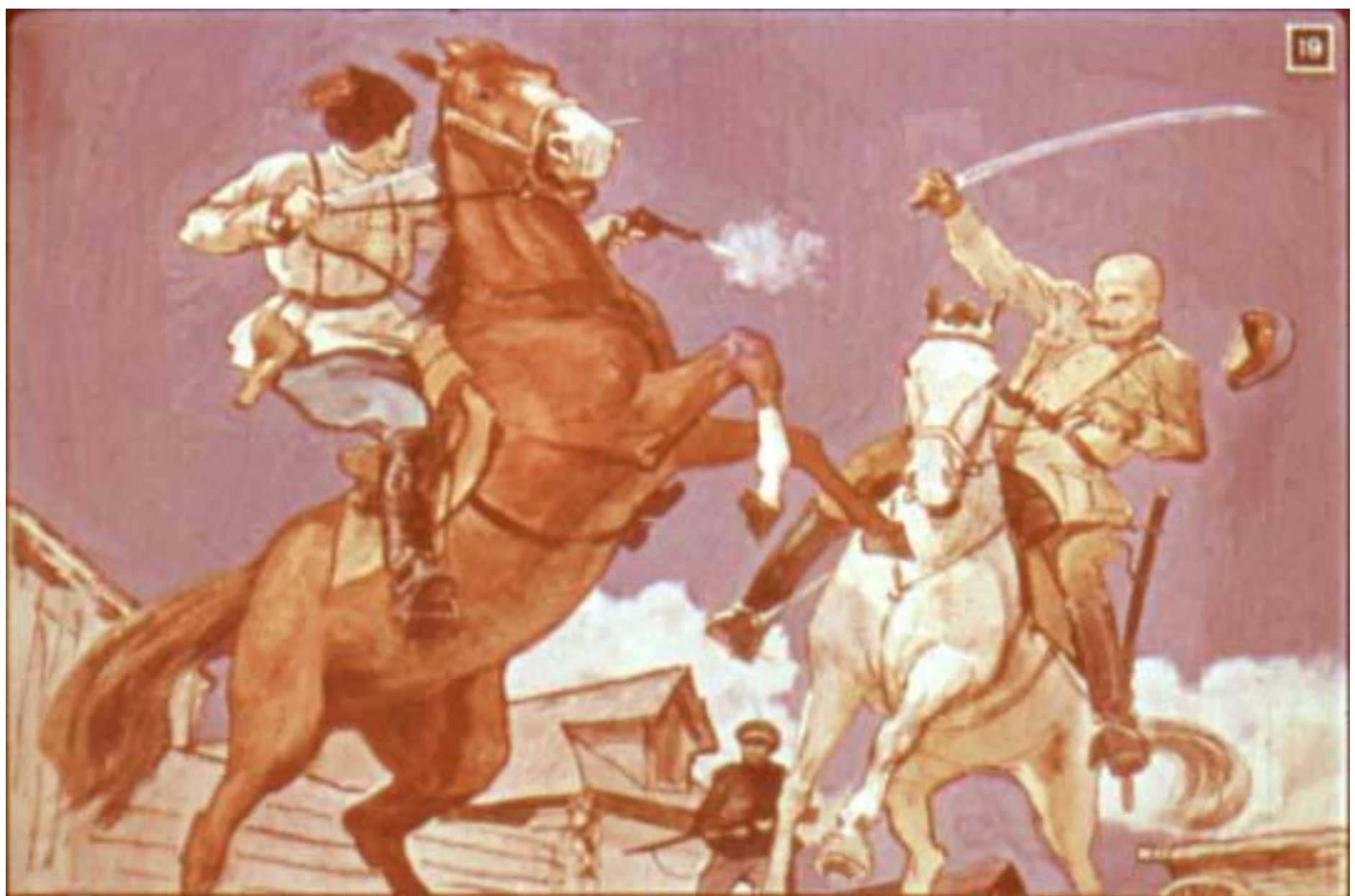
Белый офицер уже занёс шашку над головой Чапаева, но тот поднял коня на дыбы и выстрелил в беляка.