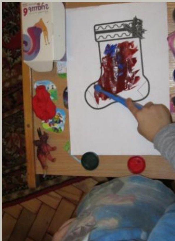
«Носочек для Деда Мороза»