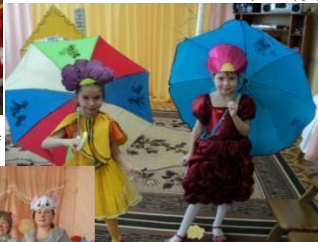
Театрализованное представление для детей «Репка»