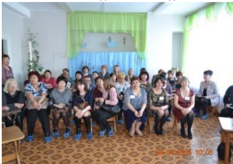
Районное методическое объединение