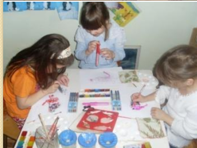
Использование в рисовании нетрадиционных техник