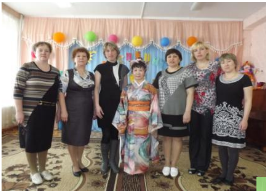
Гости из монголии «Театр одного актёра»