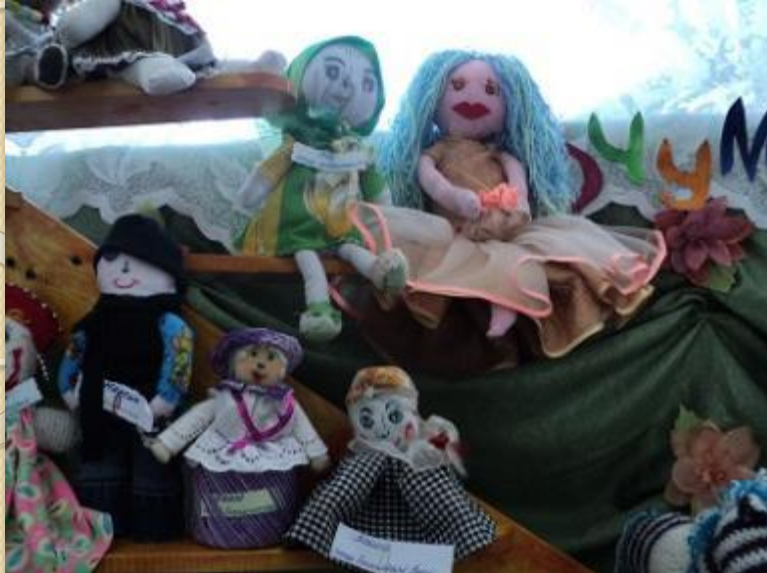
Работа с родителями. Участие в конкурсе «Текстильная кукла.» Участники награждены благодарственными письмами и грамотами