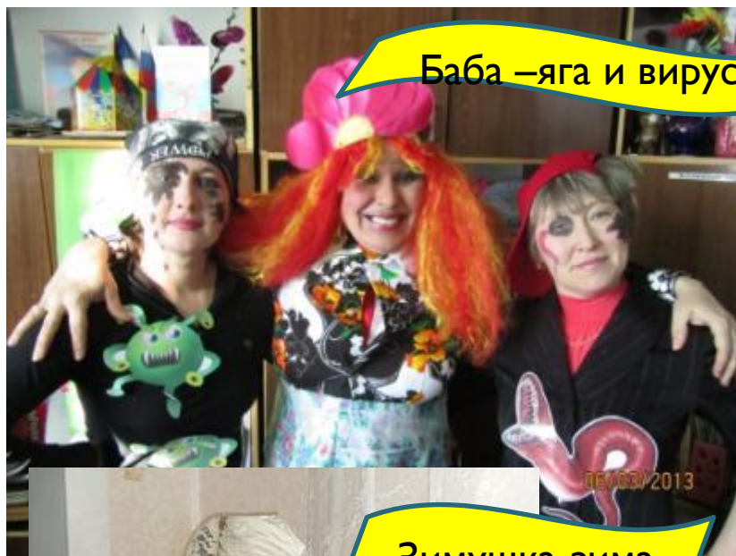
Баба –яга и вирусы