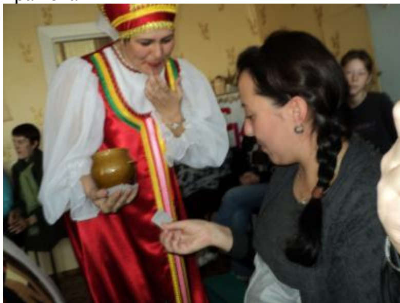
Игры с родителями-народные промыслы