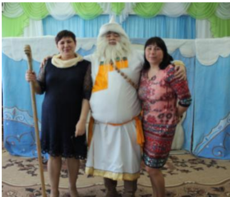
Театр « Ульгэр»