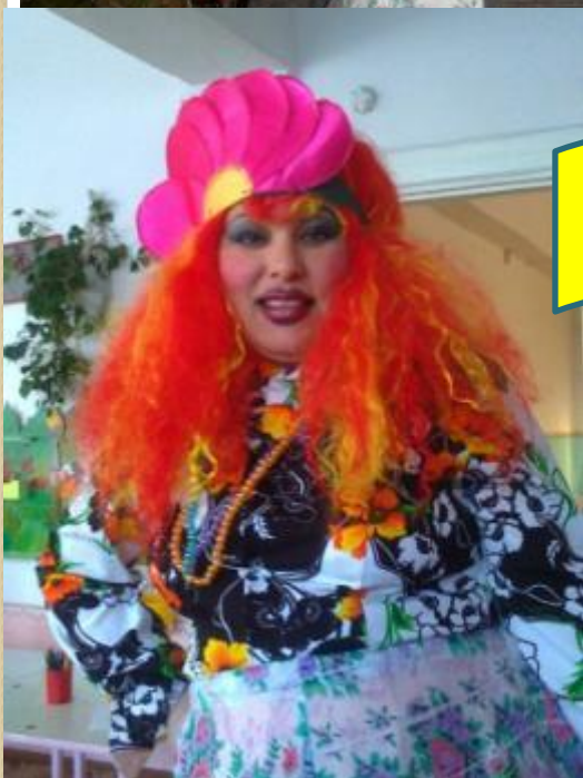
Такая разная Баба-Яга