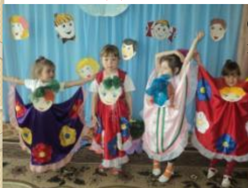
Оформление детских костюмов, головных уборов Подготовка к экологическому конкурсу