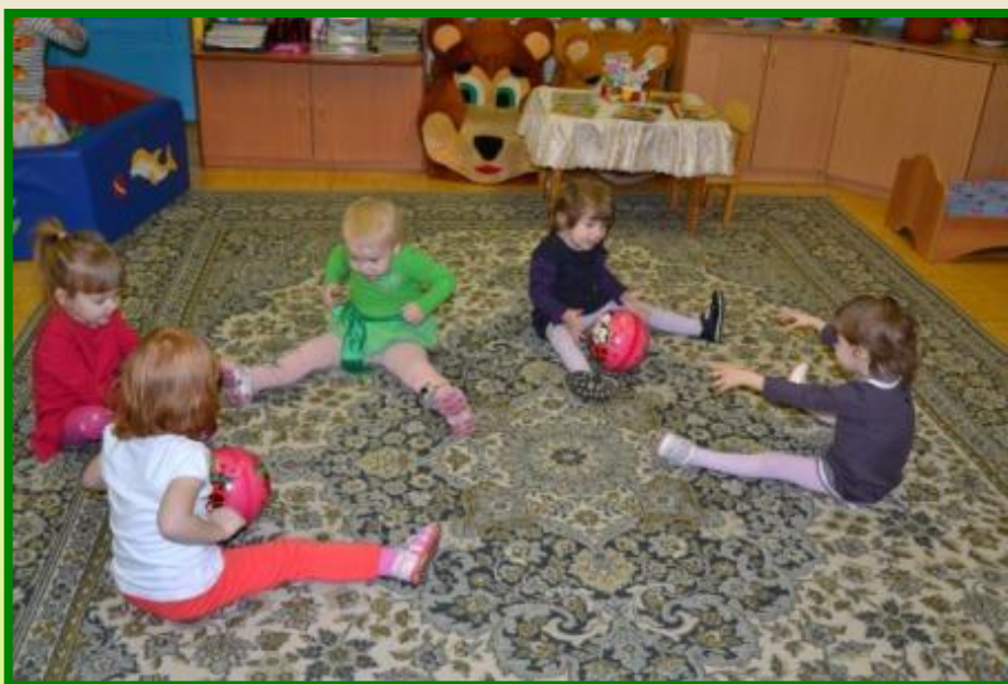
«Загони мяч в ворота»