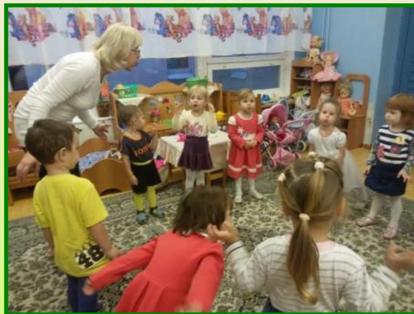
«Серый волк в густом лесу..»