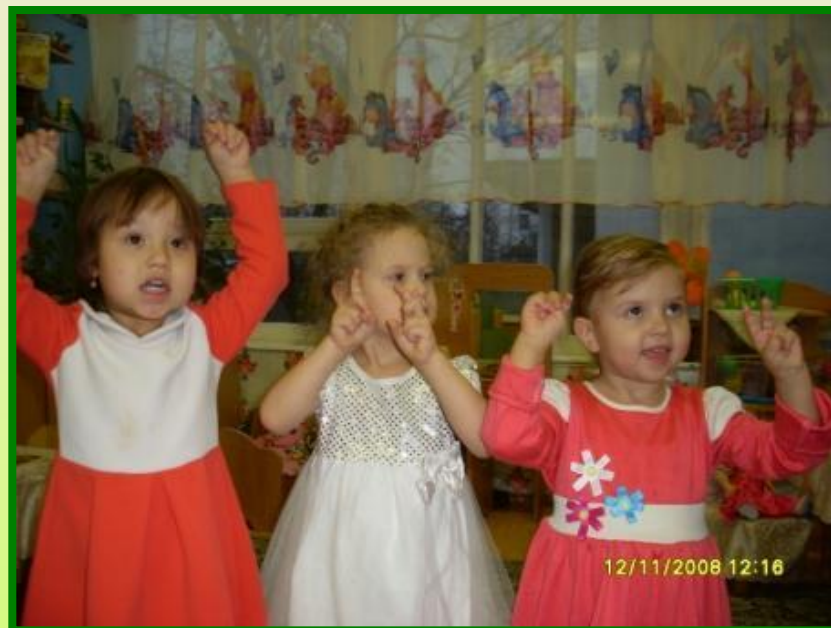
«Вы скачите зайчики..»