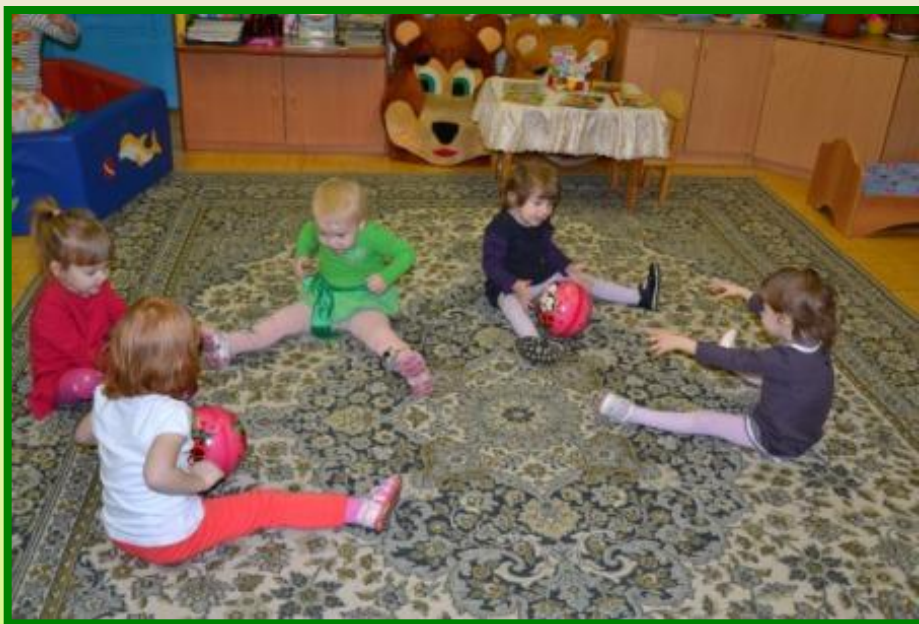
«Загони мяч в ворота»