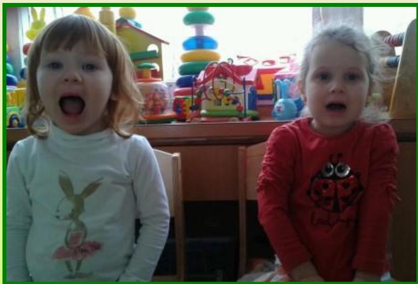
артикуляционная игра «Язычок и его домик»