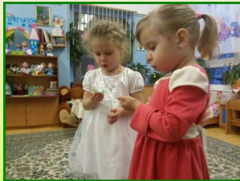
«Я подую на перо, пусть летит оно в окно...»