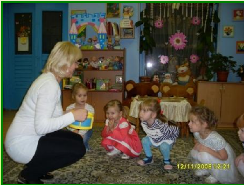
«Барабан зазвучал, серый зайка убежал»