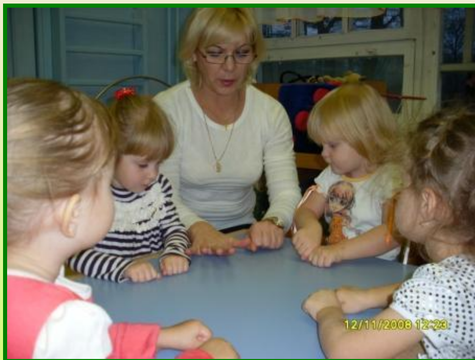
«Вот ладошка, вот кулак..»