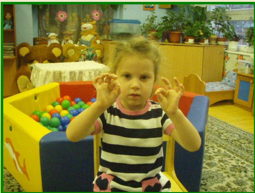
«Этот пальчик дедушка..»