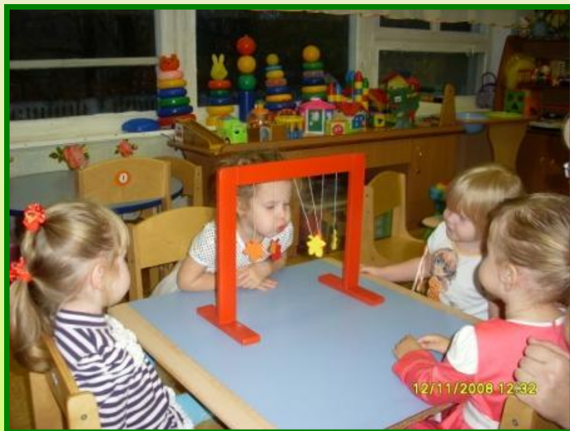
«На листики подуем..»