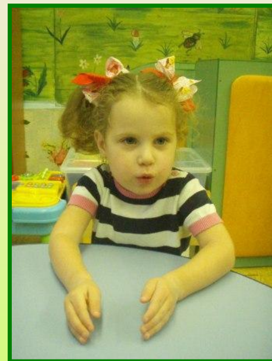
«Моя пила у-у- звонит....»