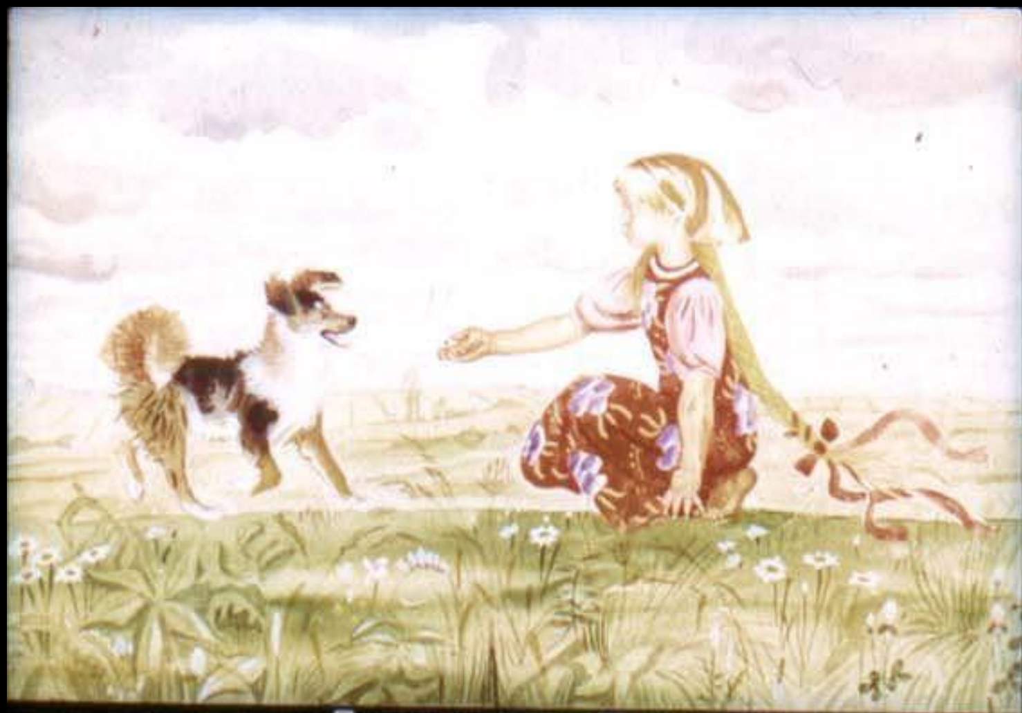
Позвала внучка Жучку.