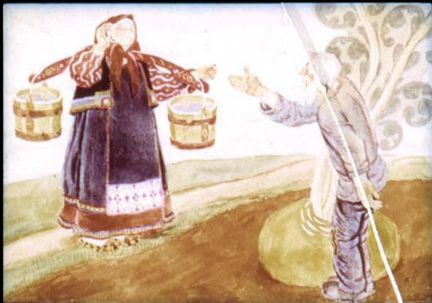
Позвал дед бабку.