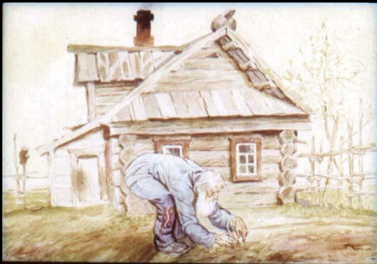
Посадил дед репку.