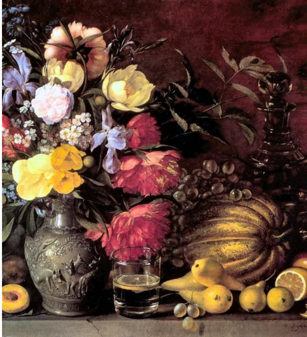
И.Т. Хруцкий «Цветы и плоды»