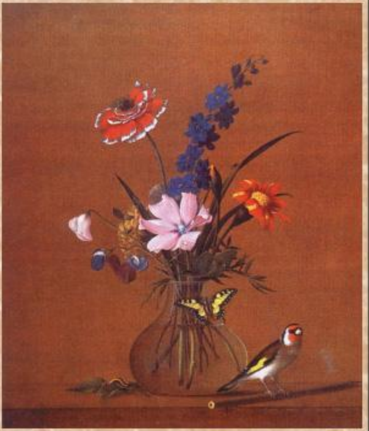
Ф. П. Толстой «Букет цветов, бабочка и птичка»