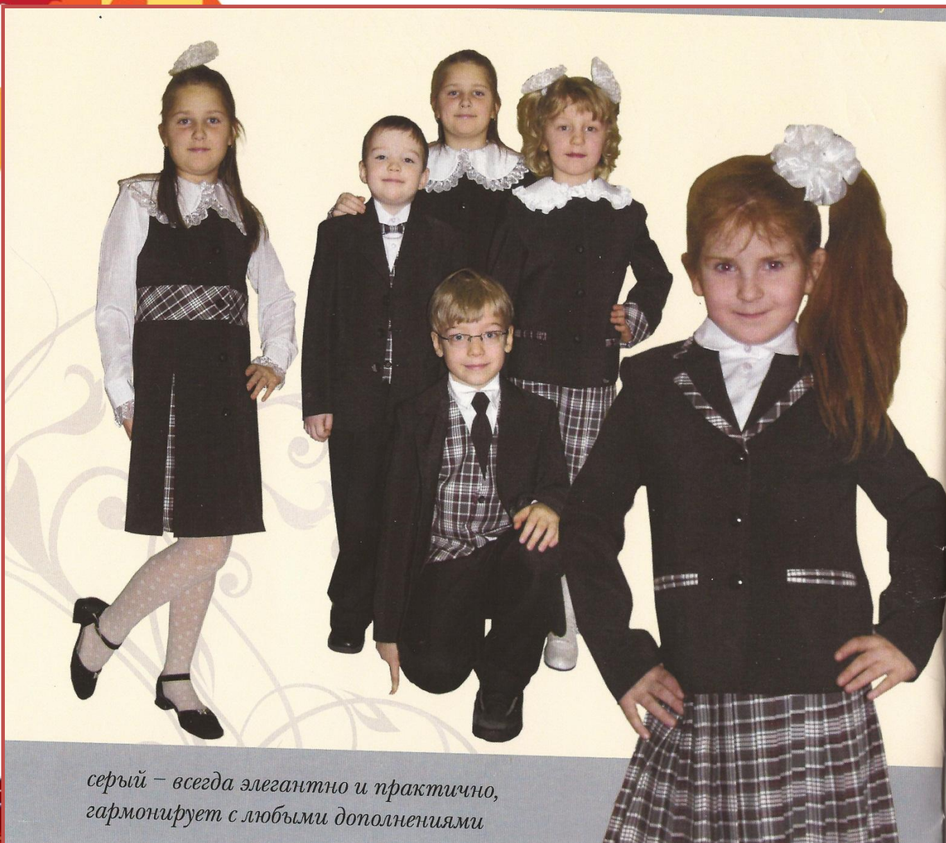
серый – всегда элегантно и практично, гармонизирует с любыми дополнениями