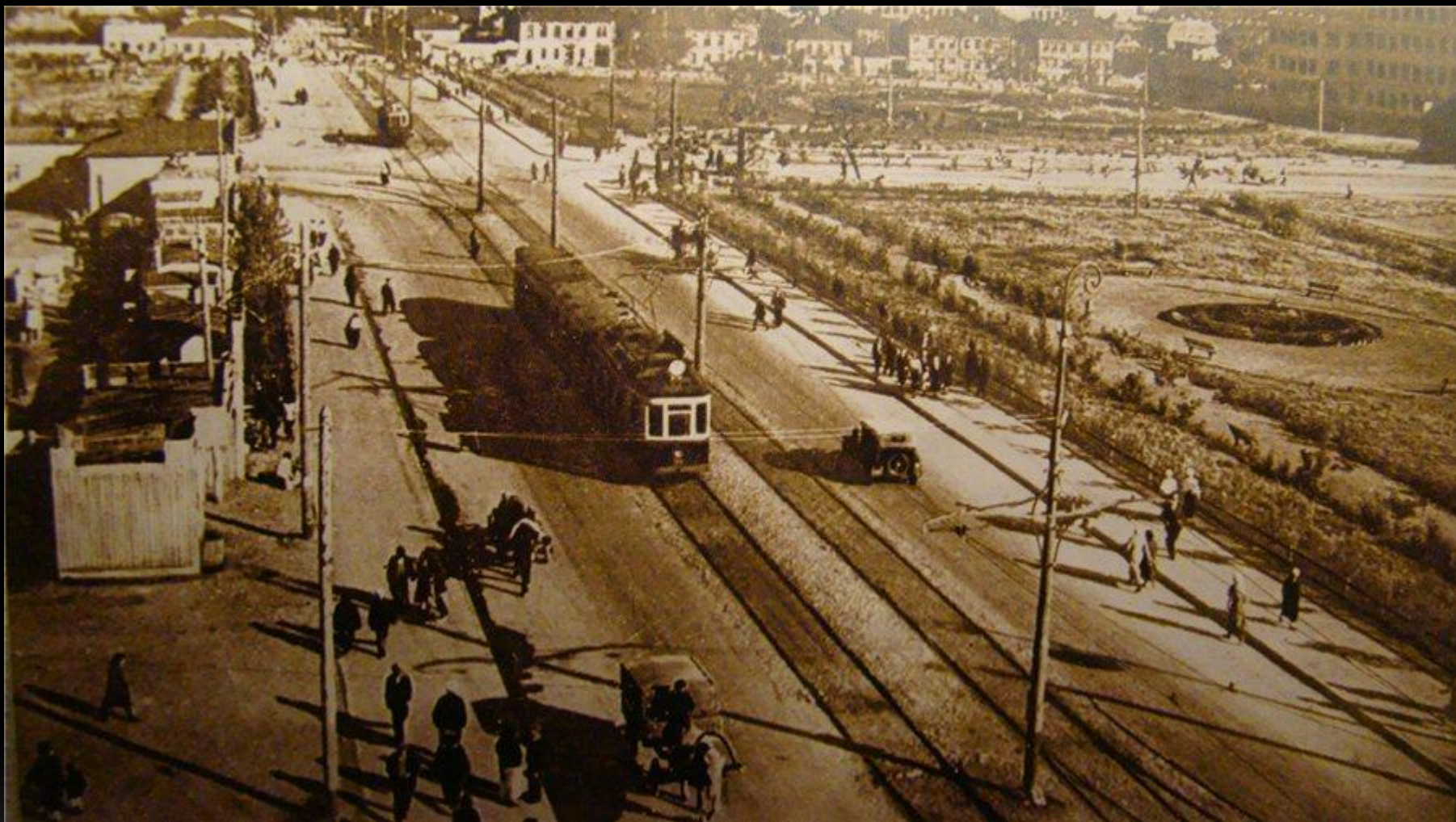
Пересечение улиц Красноармейской и Арцыбушевской