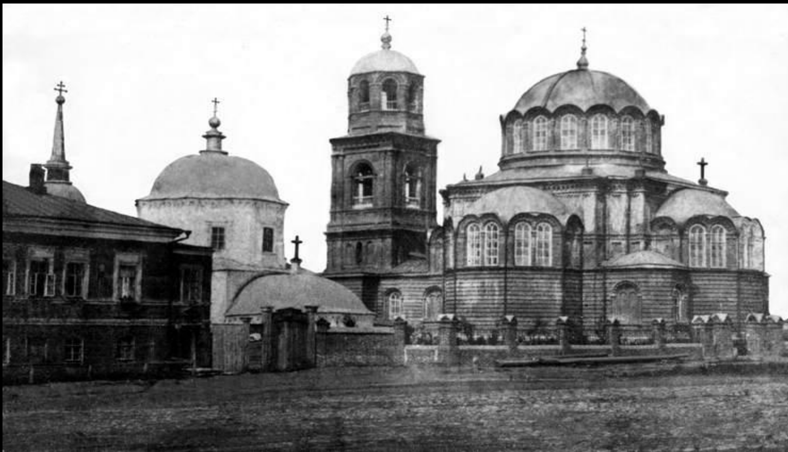
Самара. Хлебная площадь. Спасо-Преображенский собор (слева), Смоленская церковь (справа) и колокольня Казанского собора (в центре).