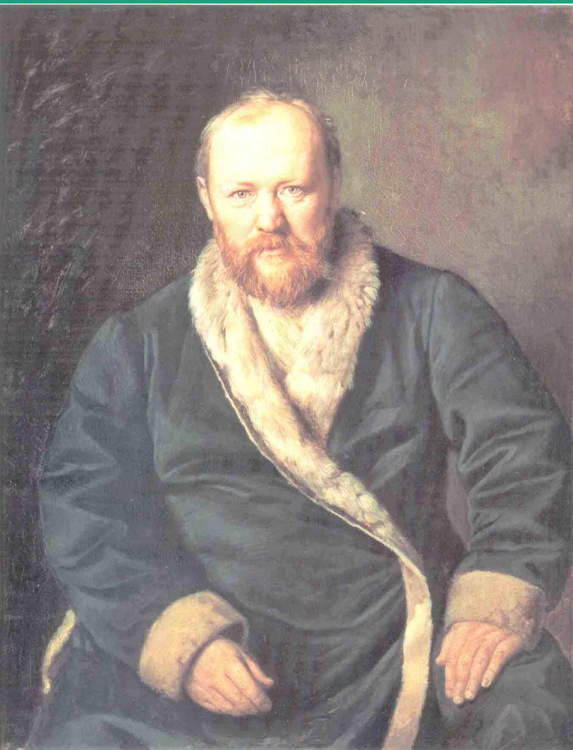
писатель-прозаик Александр Николаевич Островский (1823 – 1886)