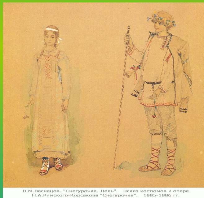
В.М.Васнецов. "Снегурочка. Лель". Эскиз костюмов к опере Н.А.Римского-Корсакова "Снегурочка". 1885-1886 гг.