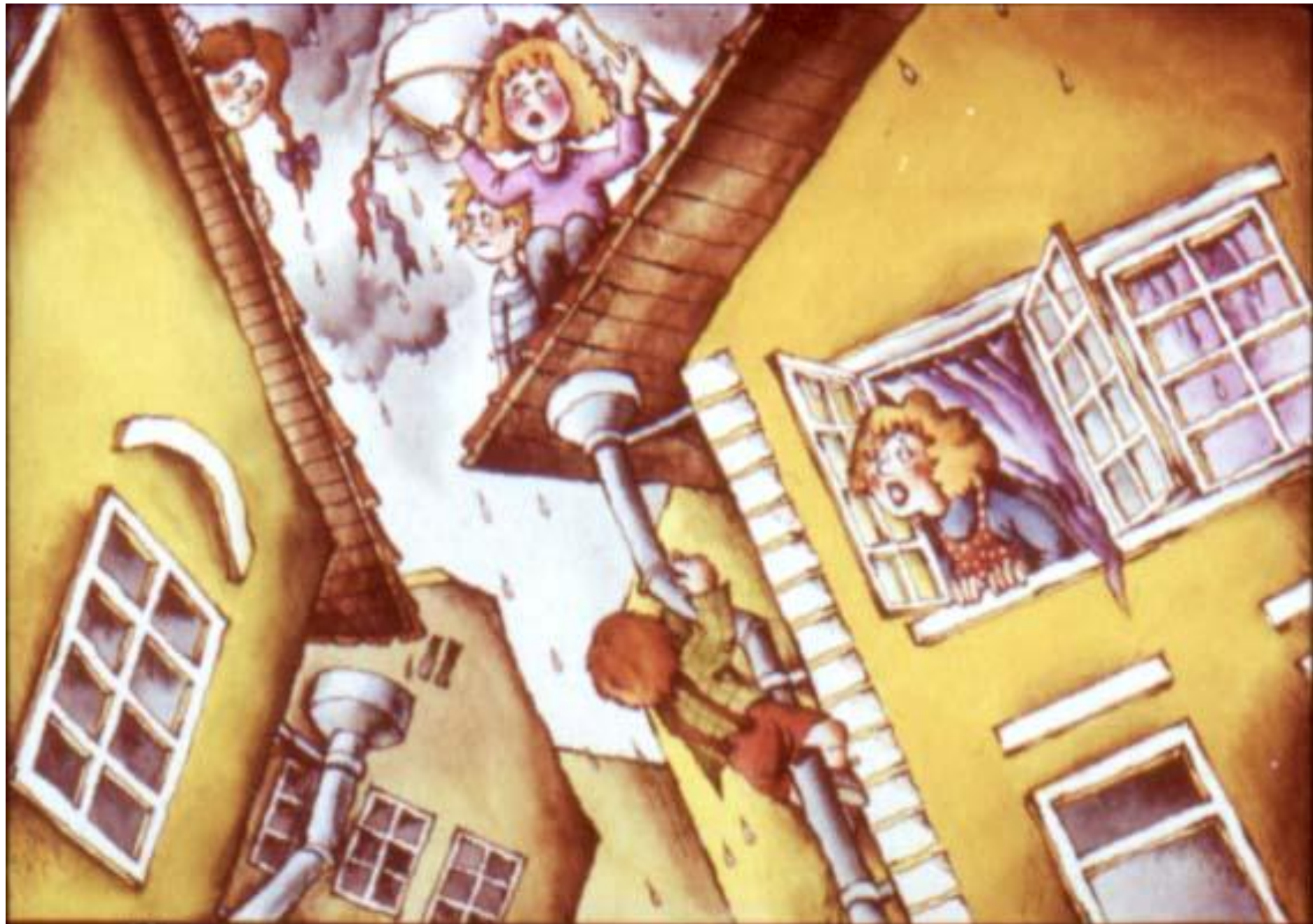
Мальчишки и девчонки на крышах ужасно промокли.