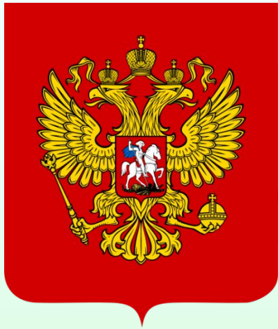
Герб Российской Федерации