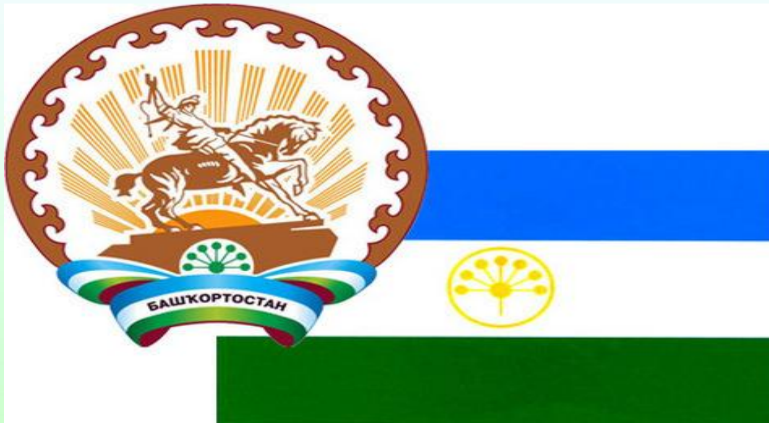
Флаг Республики Башкортостан