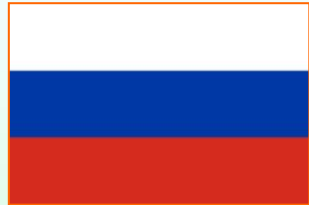
Флаг Российской Федерации