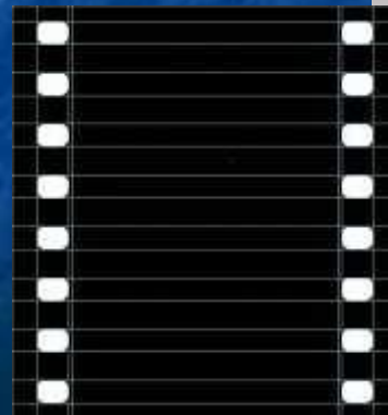
фотоплёнки и киноплёнку