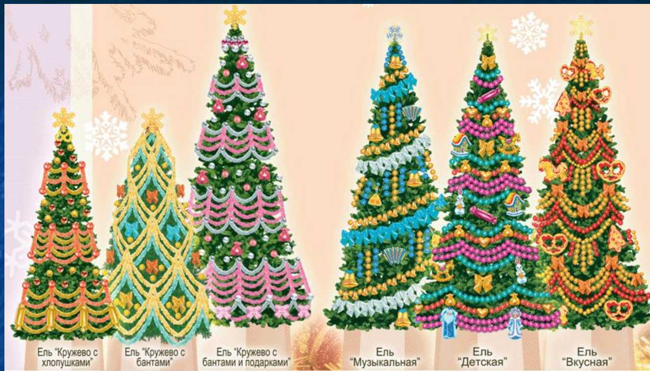
Ель "Кружево с хлопучками"