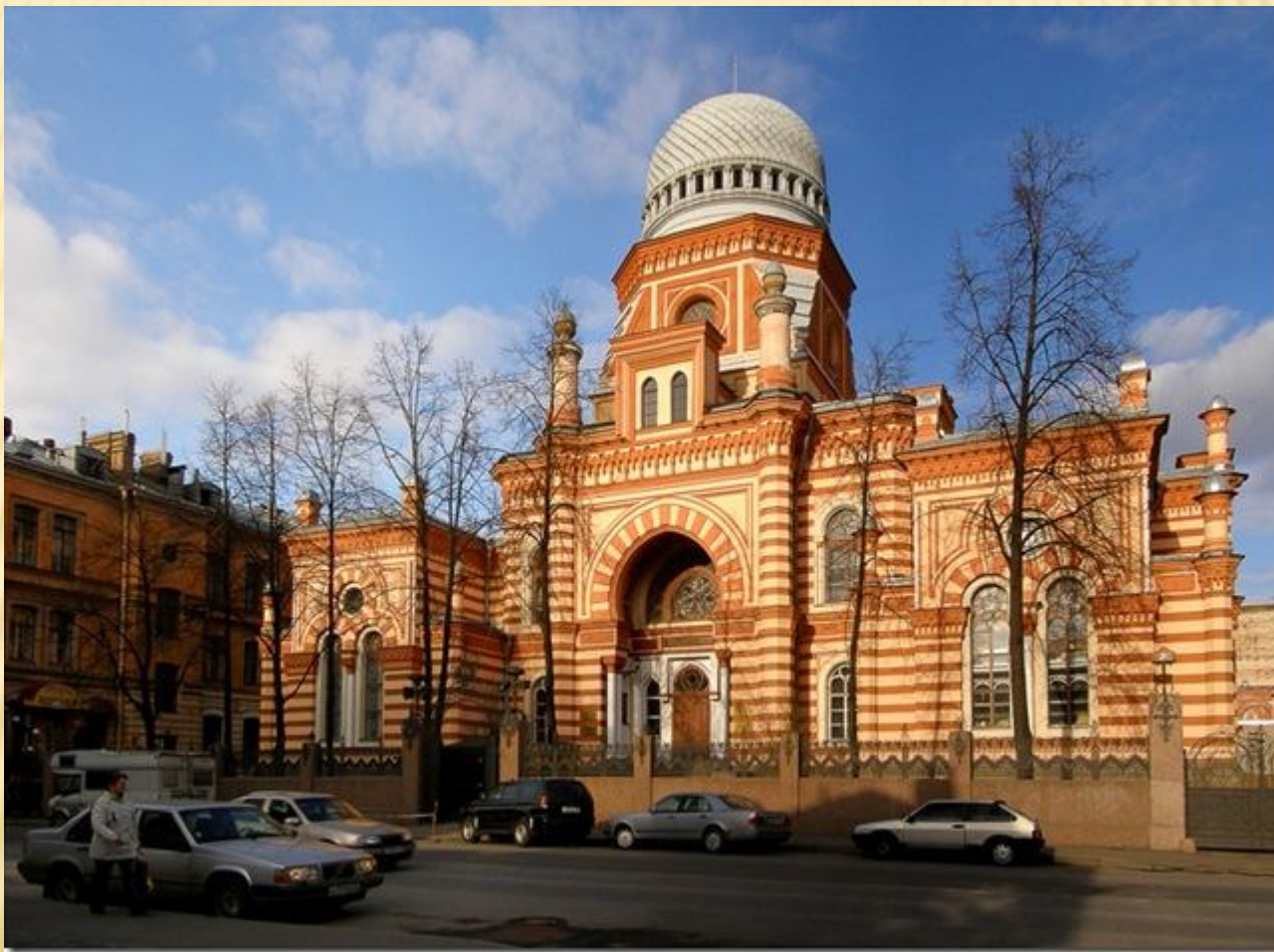
Большая Хоральная Синагога. Еврейский храм. Архитектор – Малов А.В.