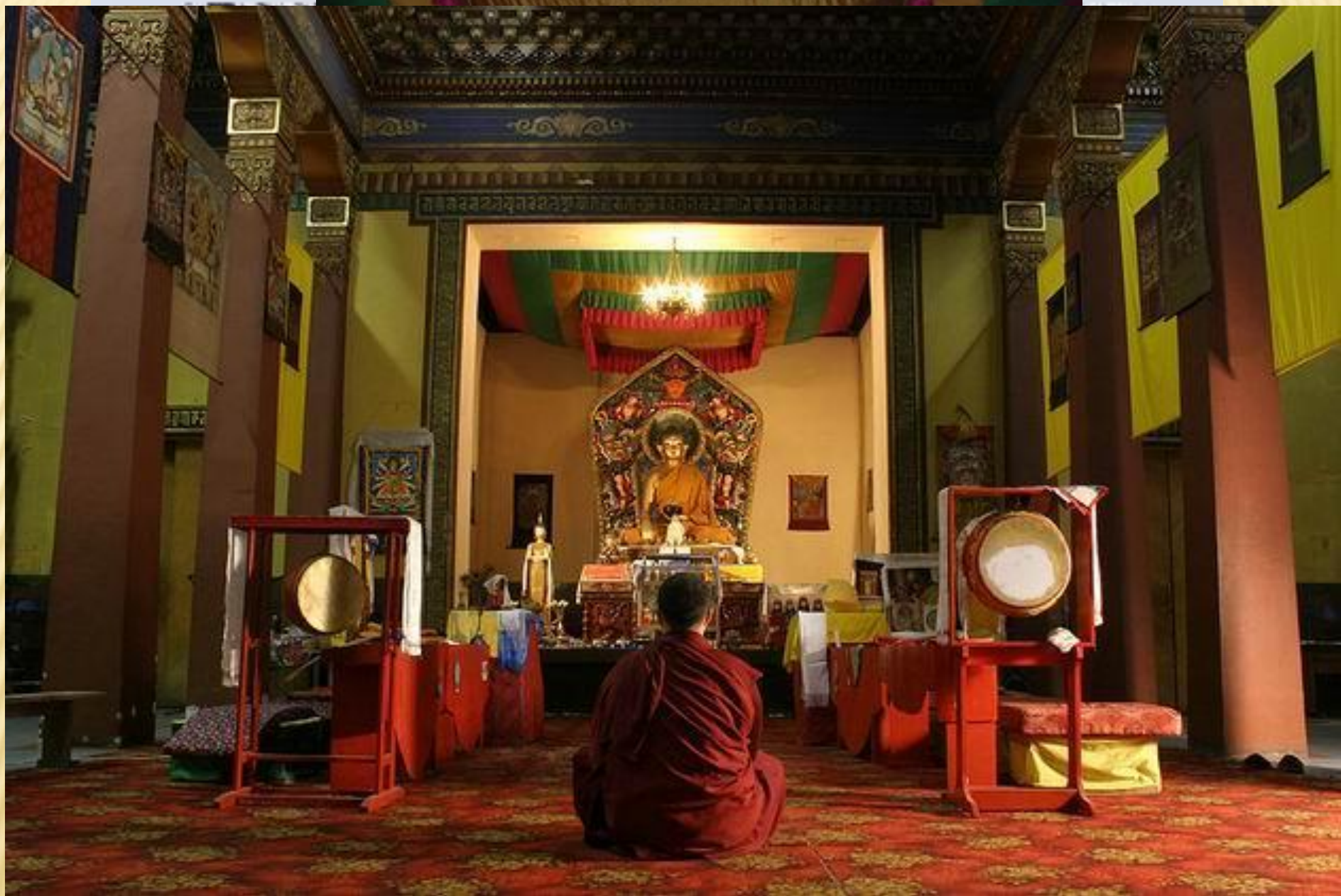
острова. До сих пор эту с