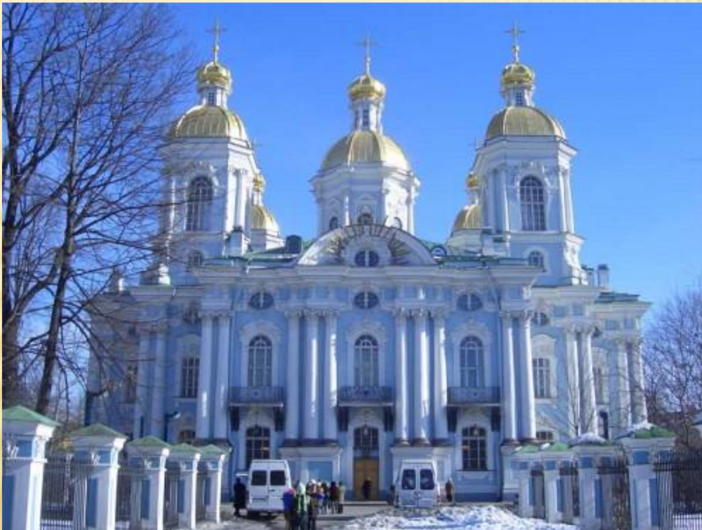
Никольский Морской Собор. Архитектор – Чевакинский С.И.