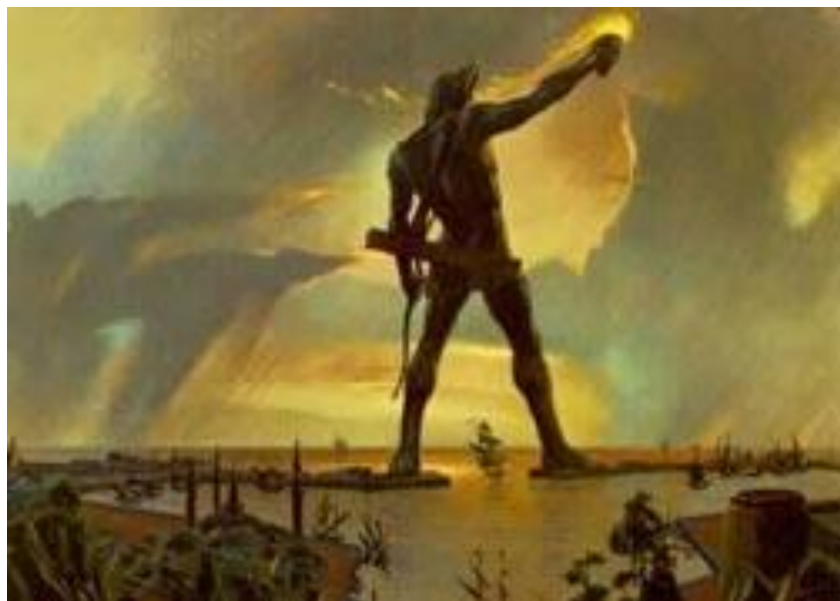
□ Колосс Родосский