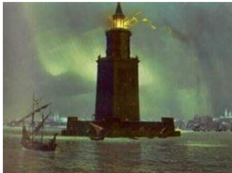
□ Александрийский маяк