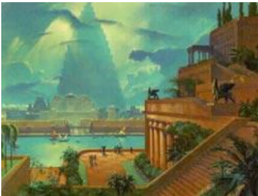
□ Висячие сады Семирамиды