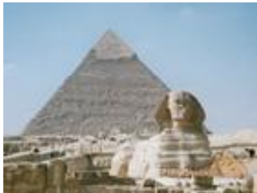
□ Пирамида Хеопса