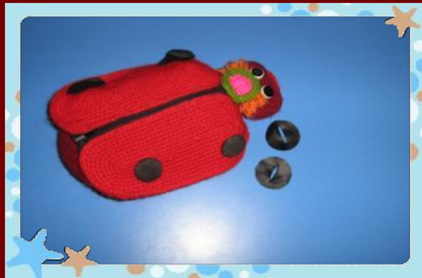
Игра «Божья коровка»