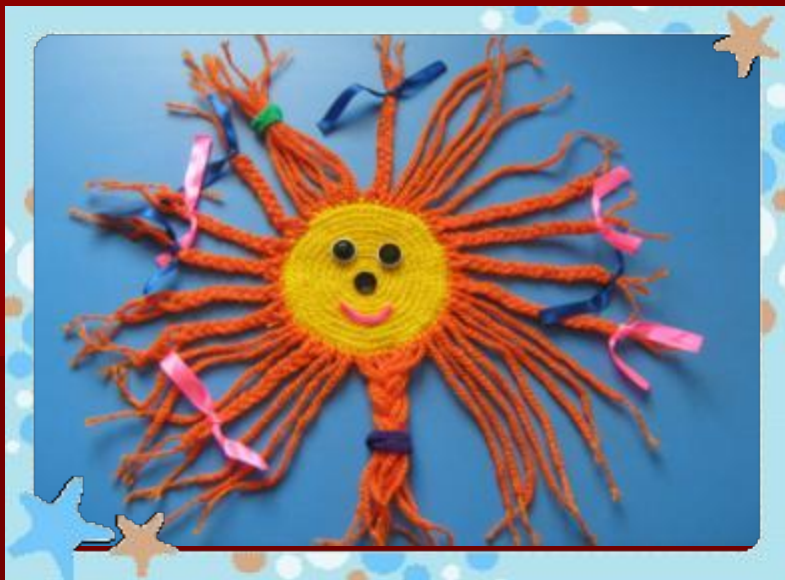
Игра « Солнышко»