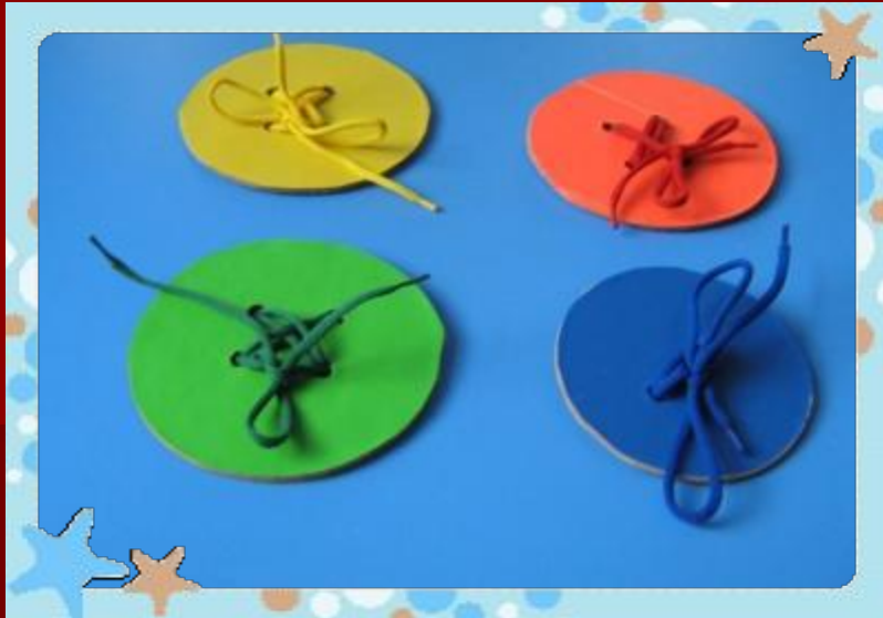
Игра « Пуговицы»