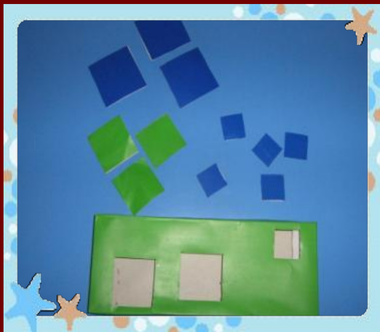
Игра «Волшебная коробочка»

Цель: развитие мелкой моторики рук, закрепление знаний об основных цветах (синий, красный, желтый, зеленый)