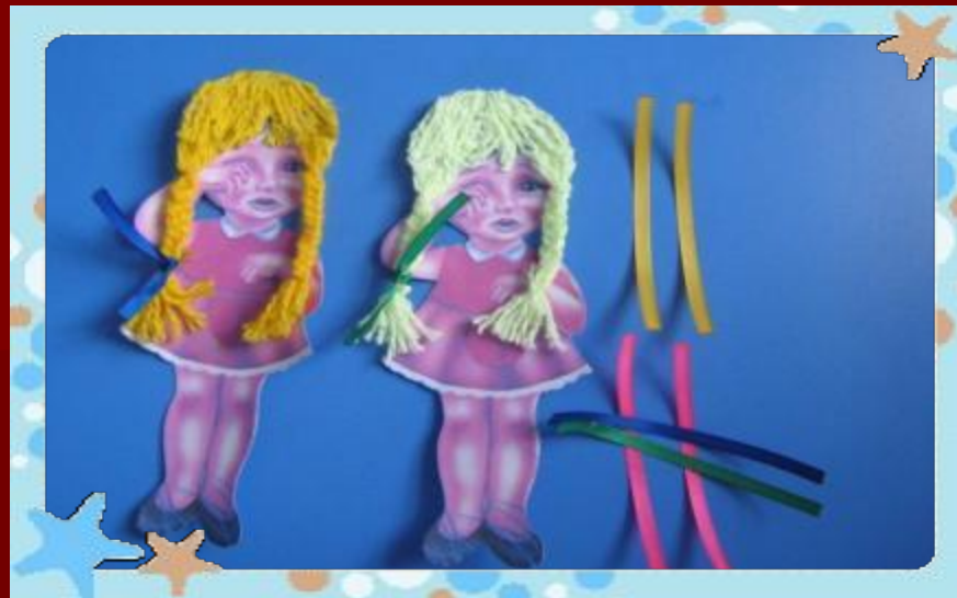
Игра « Наша Таня громко плачет»