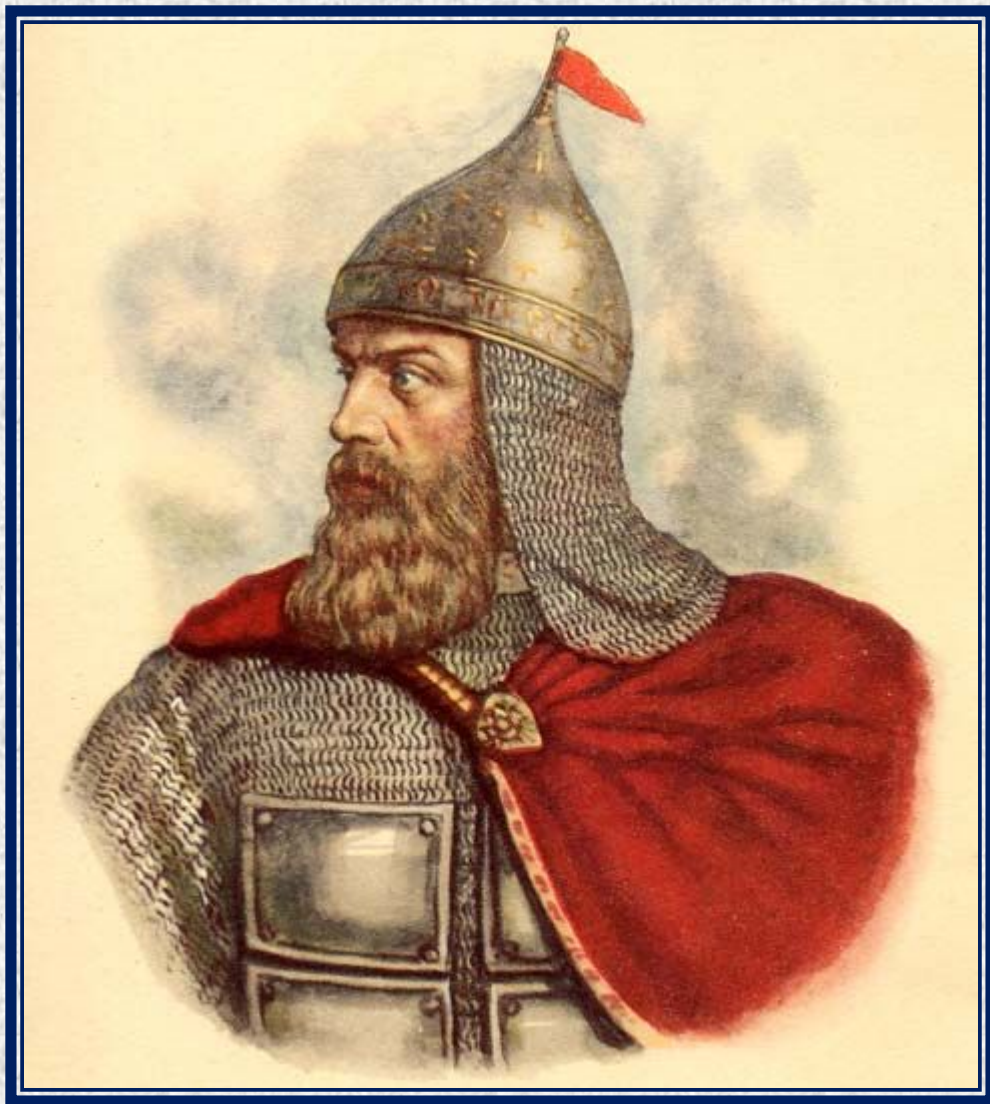
Портрет Дмитрия Донского в боевом облачении.