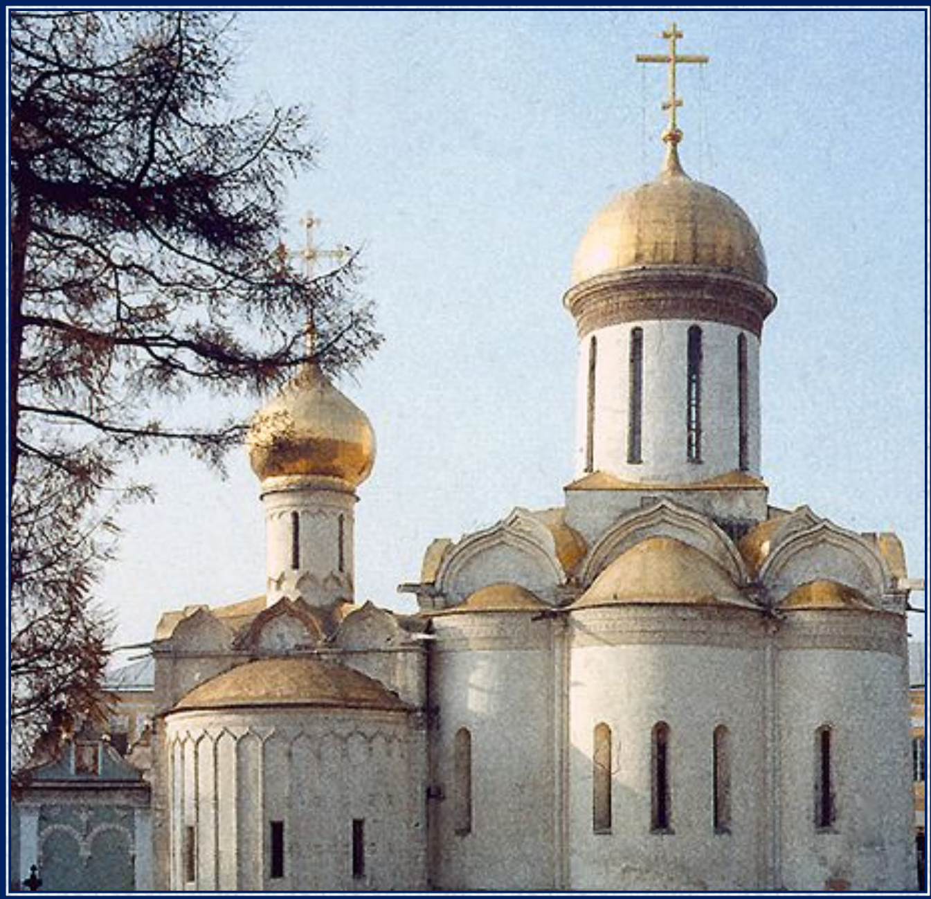
Троице-Сергиева лавра. Троицкий собор (1422-1423)