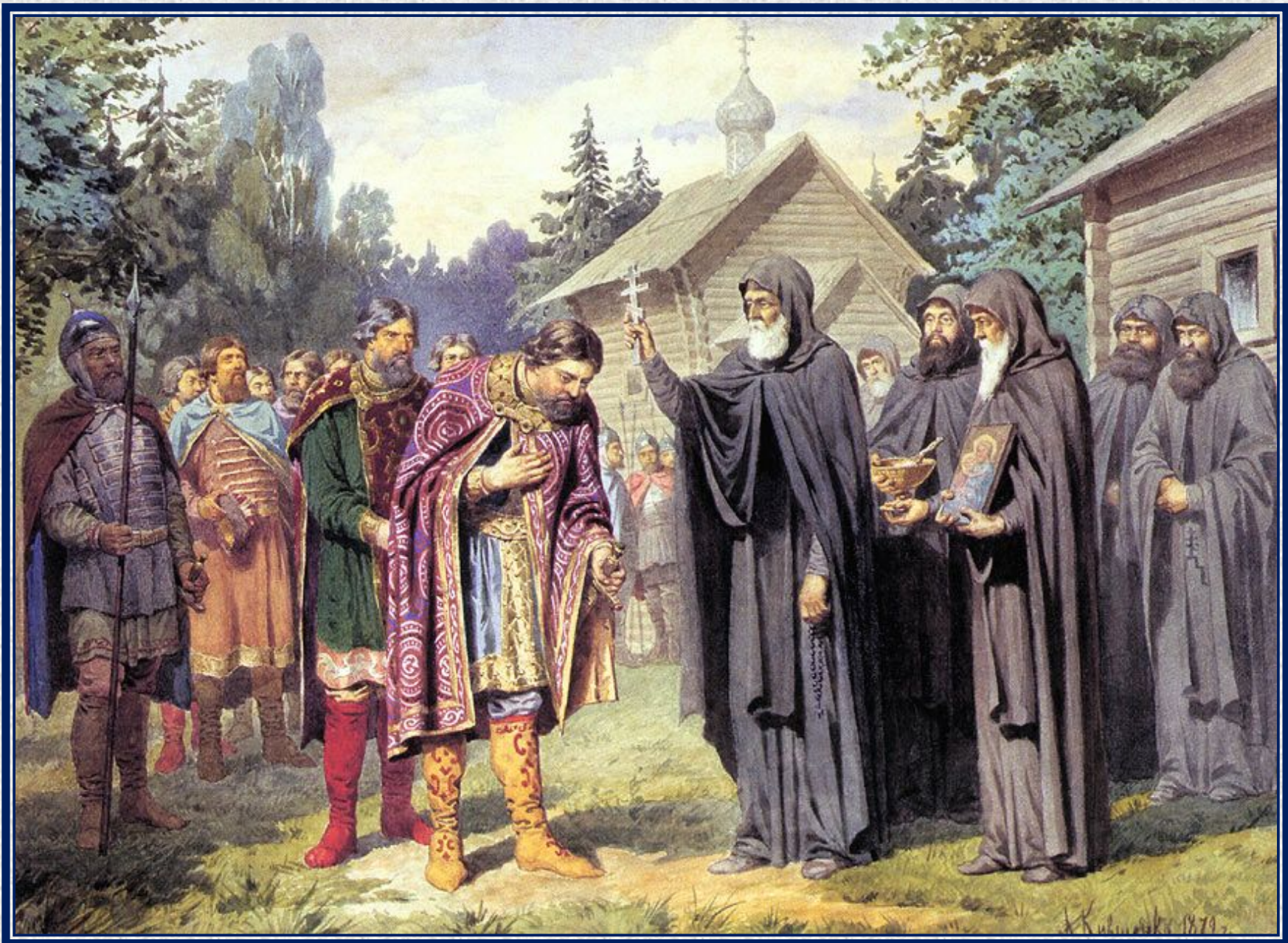
А. Д. Кившенко. «Посещение великим князем Дмитрием Сергия Радонежского перед выступлением в поход на татар. 1380 год».