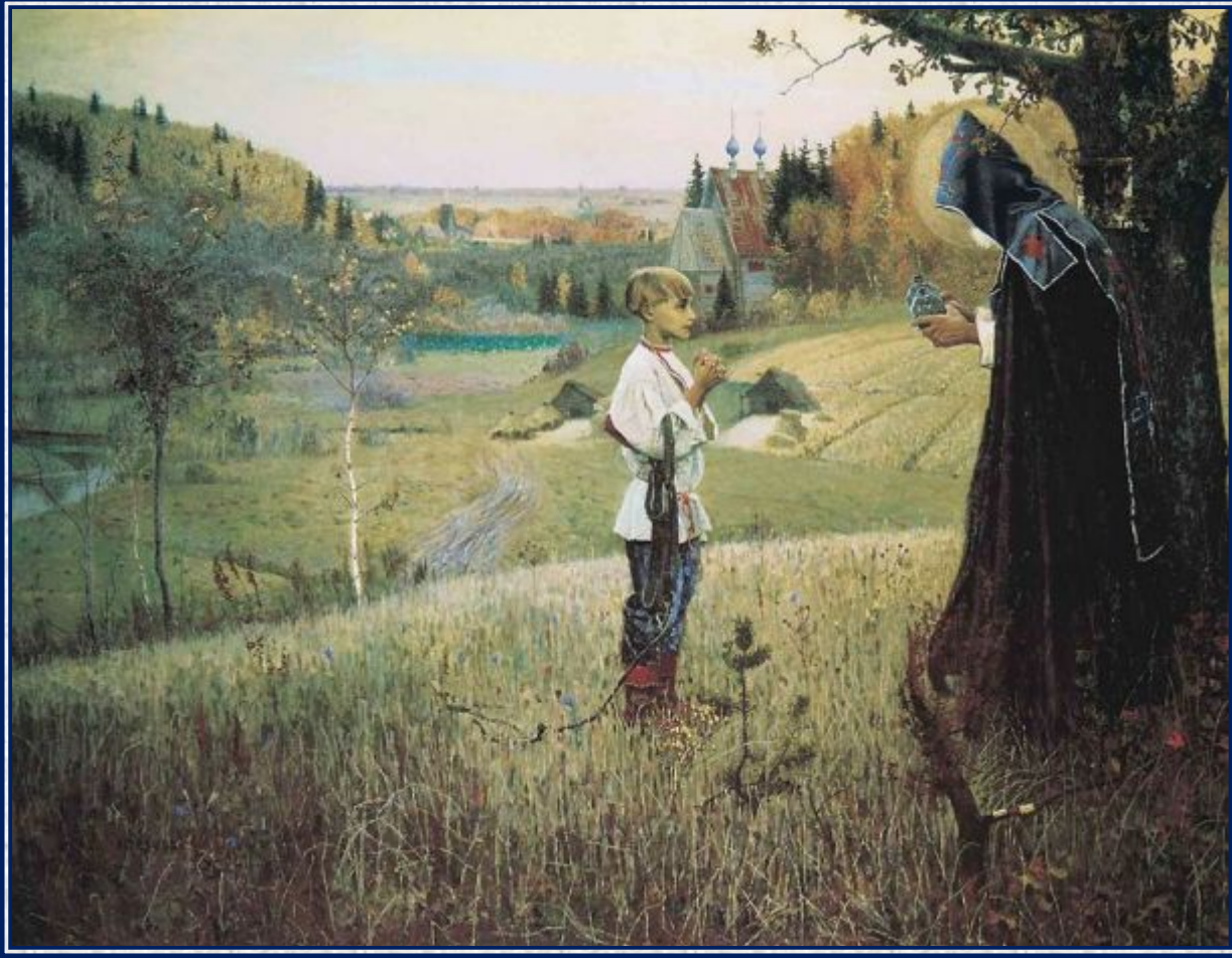
М.В. Нестеров. Видение отроку Варфоломею 1889 год.

Родился в боярской семье, в селе Варницы, близ Ростова. Его отца звали Кириллом, мать — Марией. В семилетнем возрасте мальчика отдали в школу. По легенде, сначала грамота давалась с трудом, но затем Варфоломей увлекся учебой и показал отличные способности. Позднее, его семья, страдавшая от татарских поборов и княжеских усобиц, переселилась в Московское княжество.