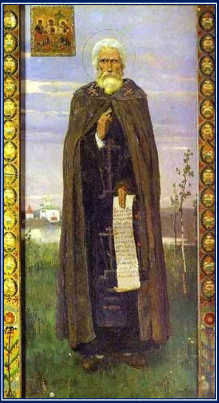
Сергий Радонежский. Икона 20

Основание Троицкого монастыря относят к 1330-1340-м годам.