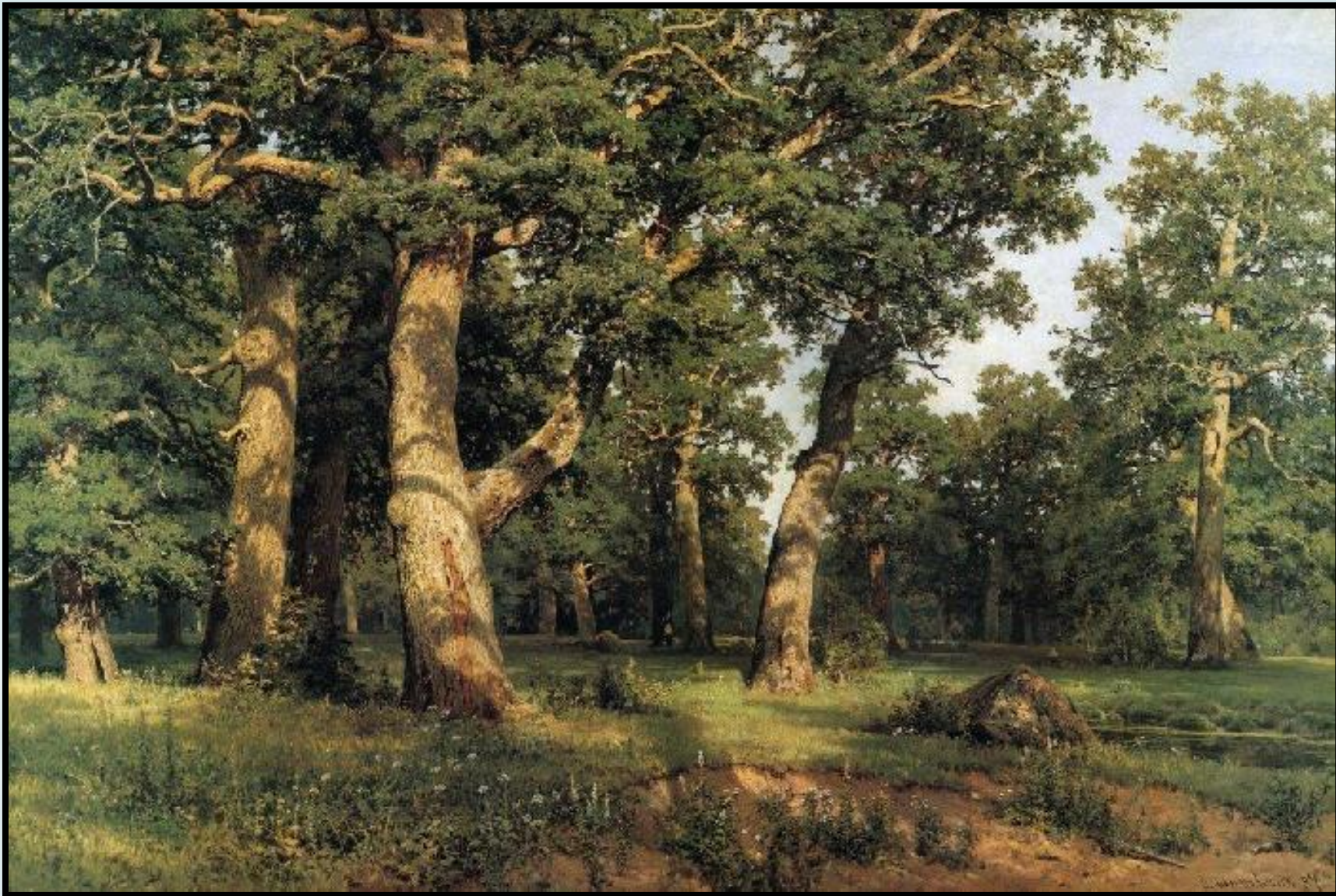
Дубовая роща. 1887