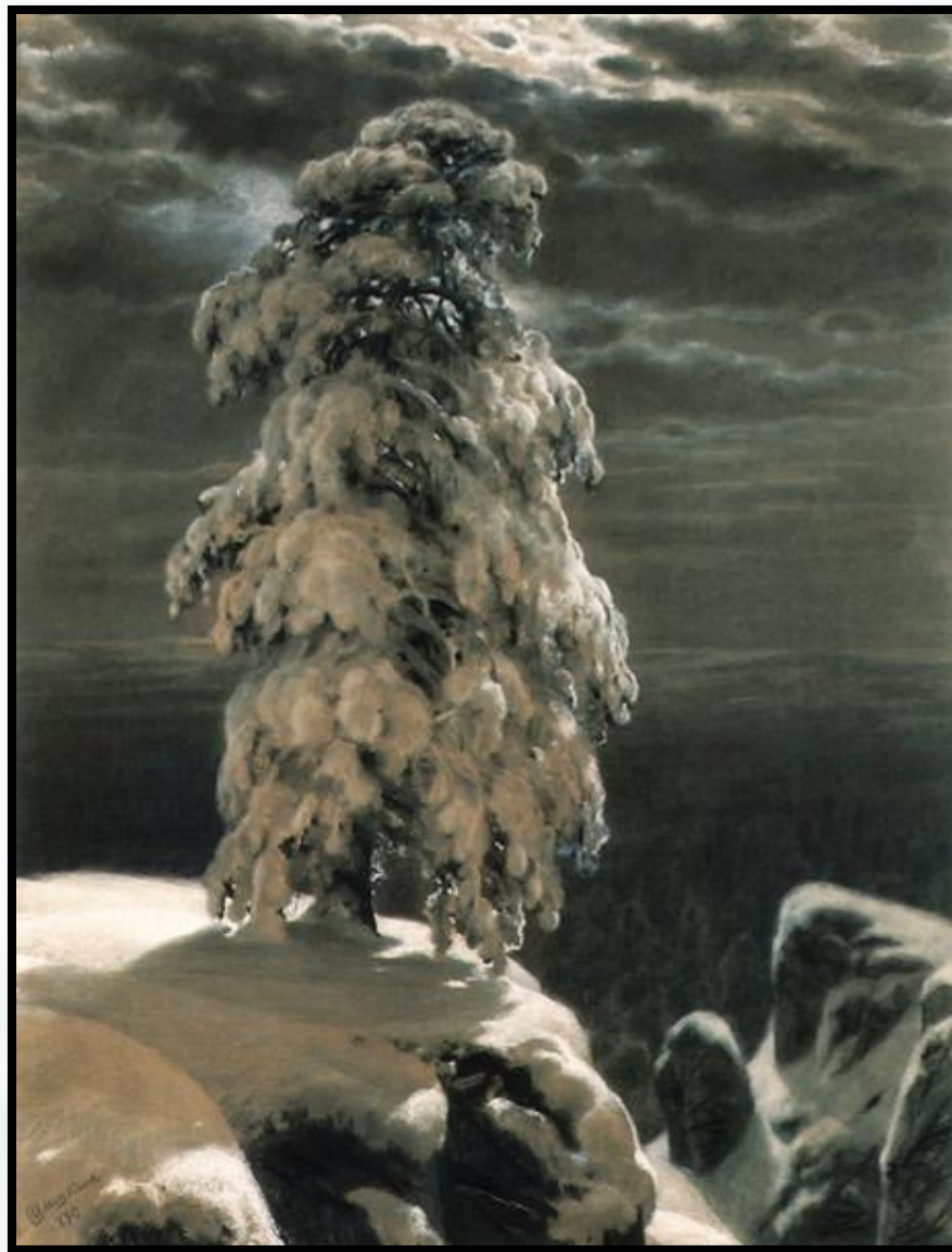
На севере диком... 1890