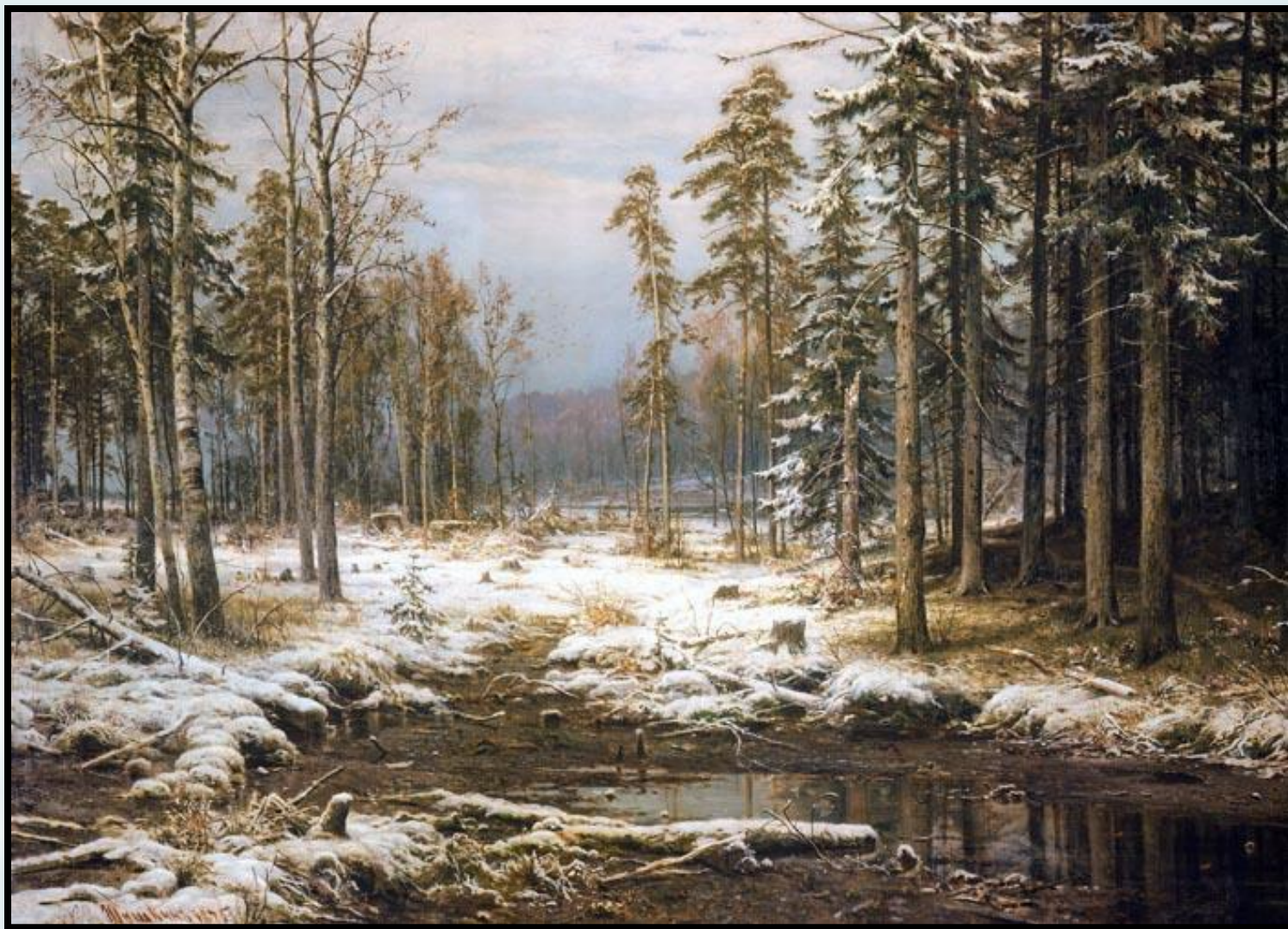
Первый снег. 1875