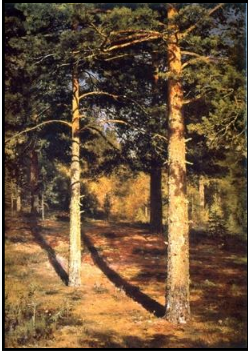
Сосны, освещенные солнцем. 1886