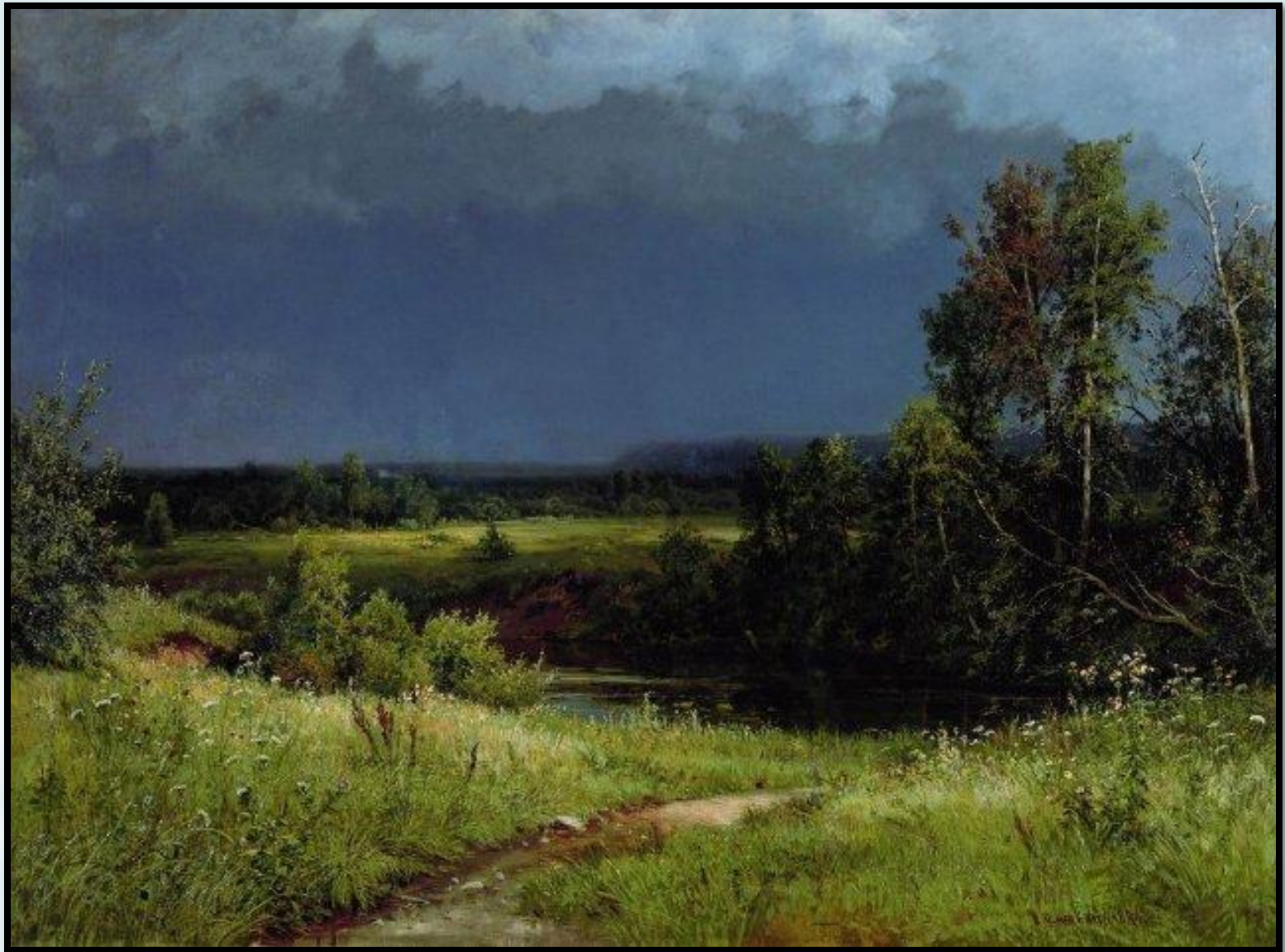
Перед грозой. 1884