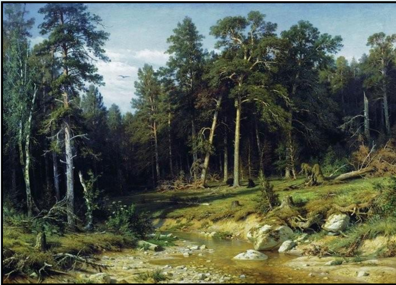
Сосновый бор. 1872