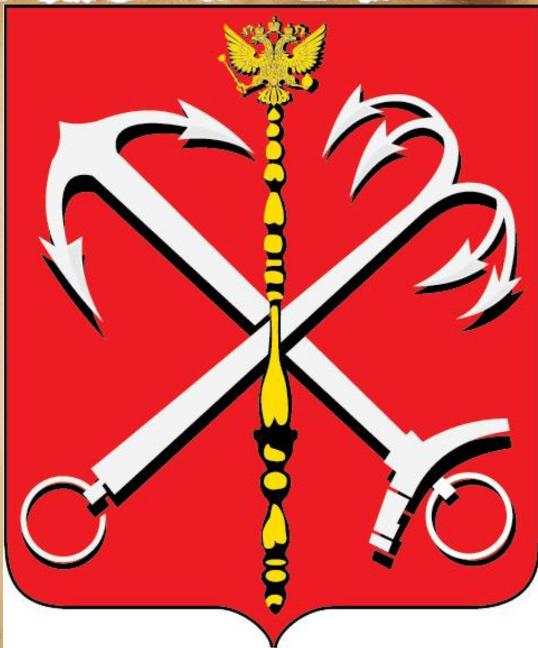
Малый герб Санкт-Петербурга

За скипетром перекрещиваются 2 якоря. Один из них морской – с двумя лапами. Другой – речной. У него 4 лапы. Он называется якорь- кошка. Якоря обычно рисуют золотыми или серебряными. Якоря говорят о том, что Санкт-Петербург – город морской и речной. Он стоит на берегах Невы и Балтийского моря.