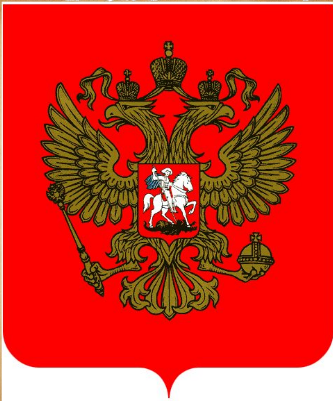
Государственный герб Российской Федерации