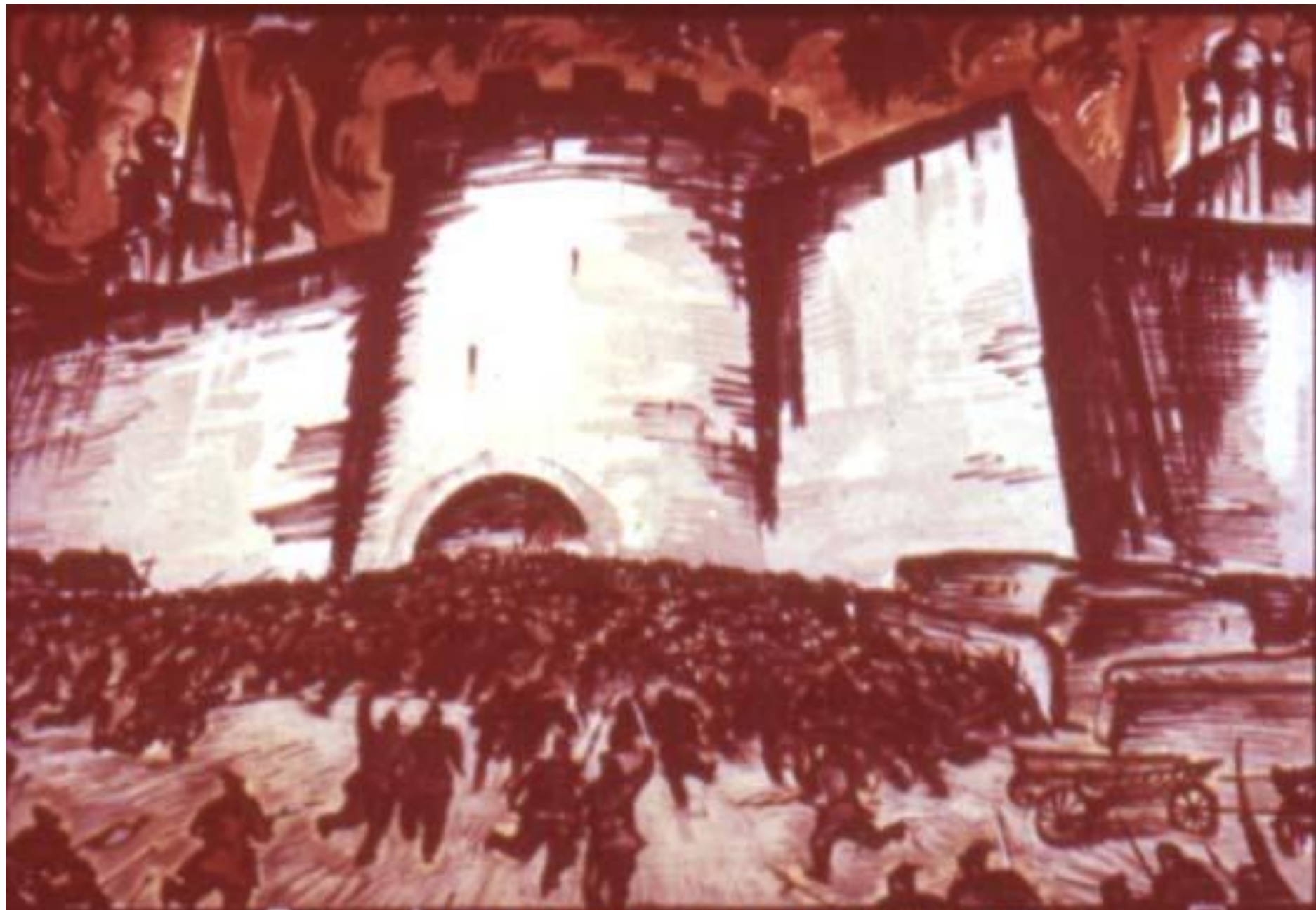
Взяли Астрахань войска атамана-назана.