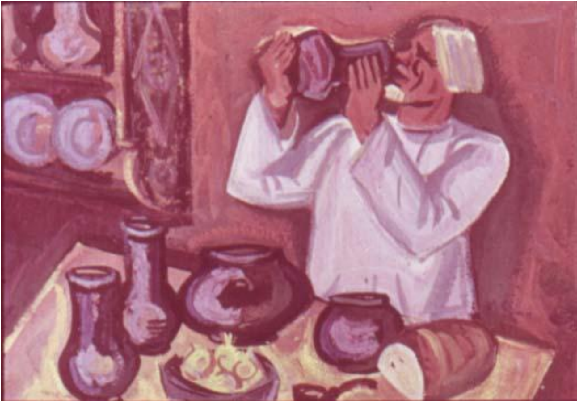
Ест за четверых,