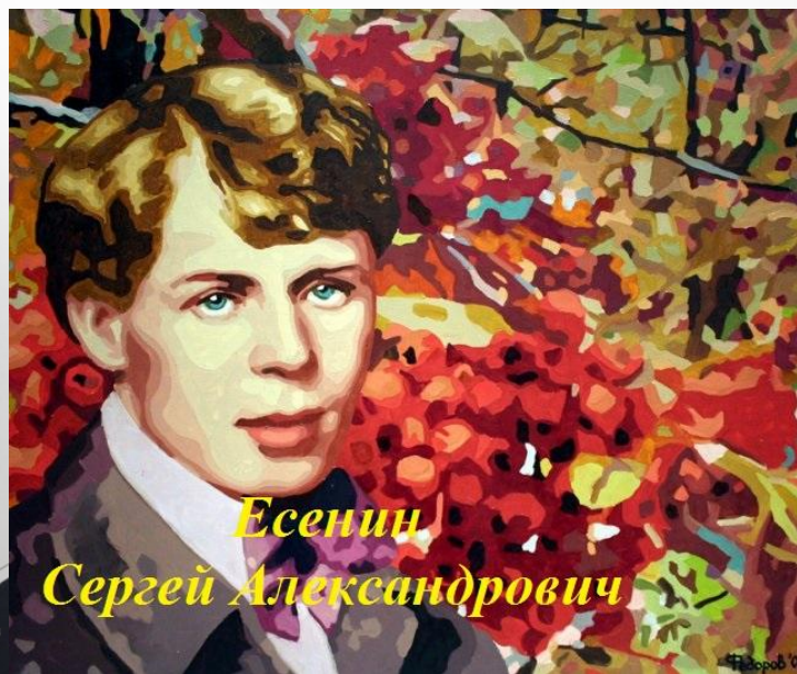
Есенин Сергей Александрович