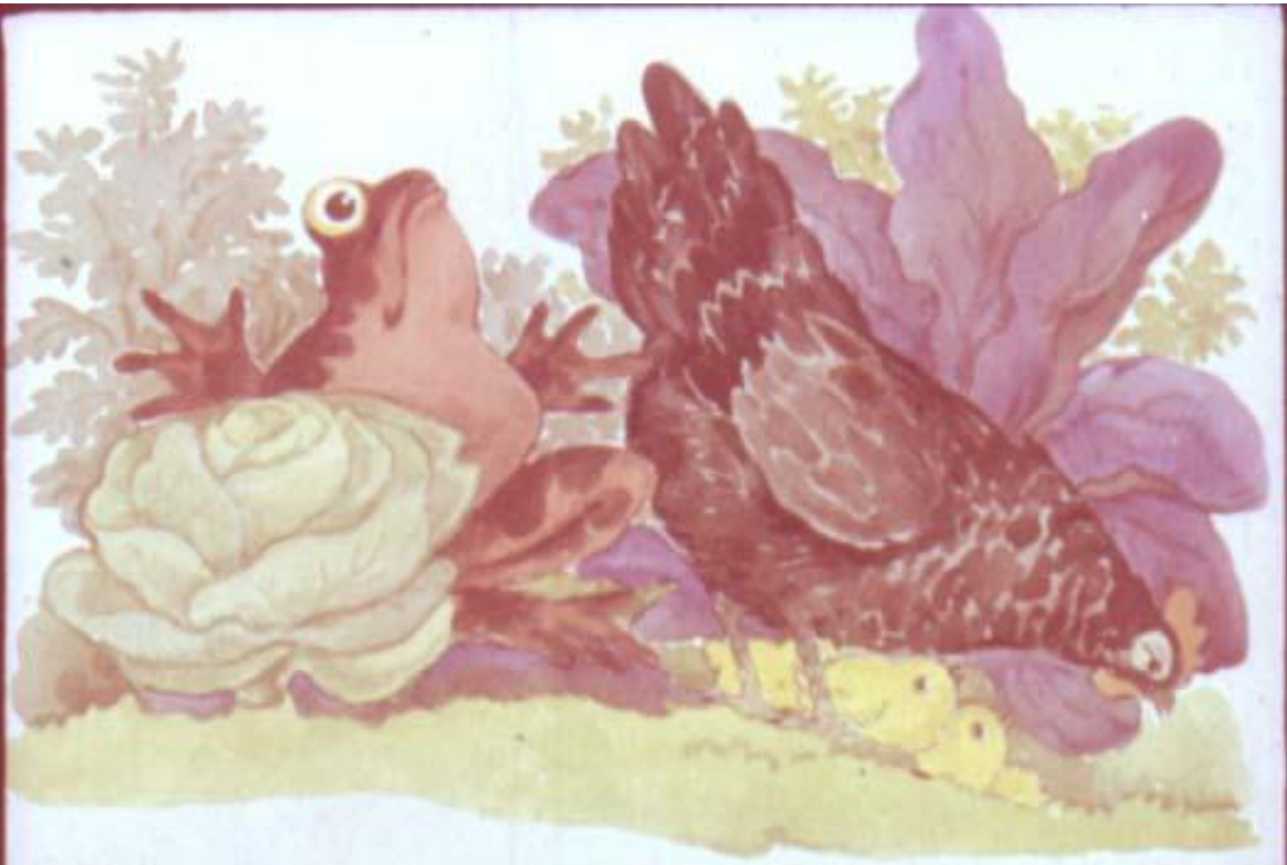
Сникла курица, отошла в сторонку и цыплят за собой увела. [19]