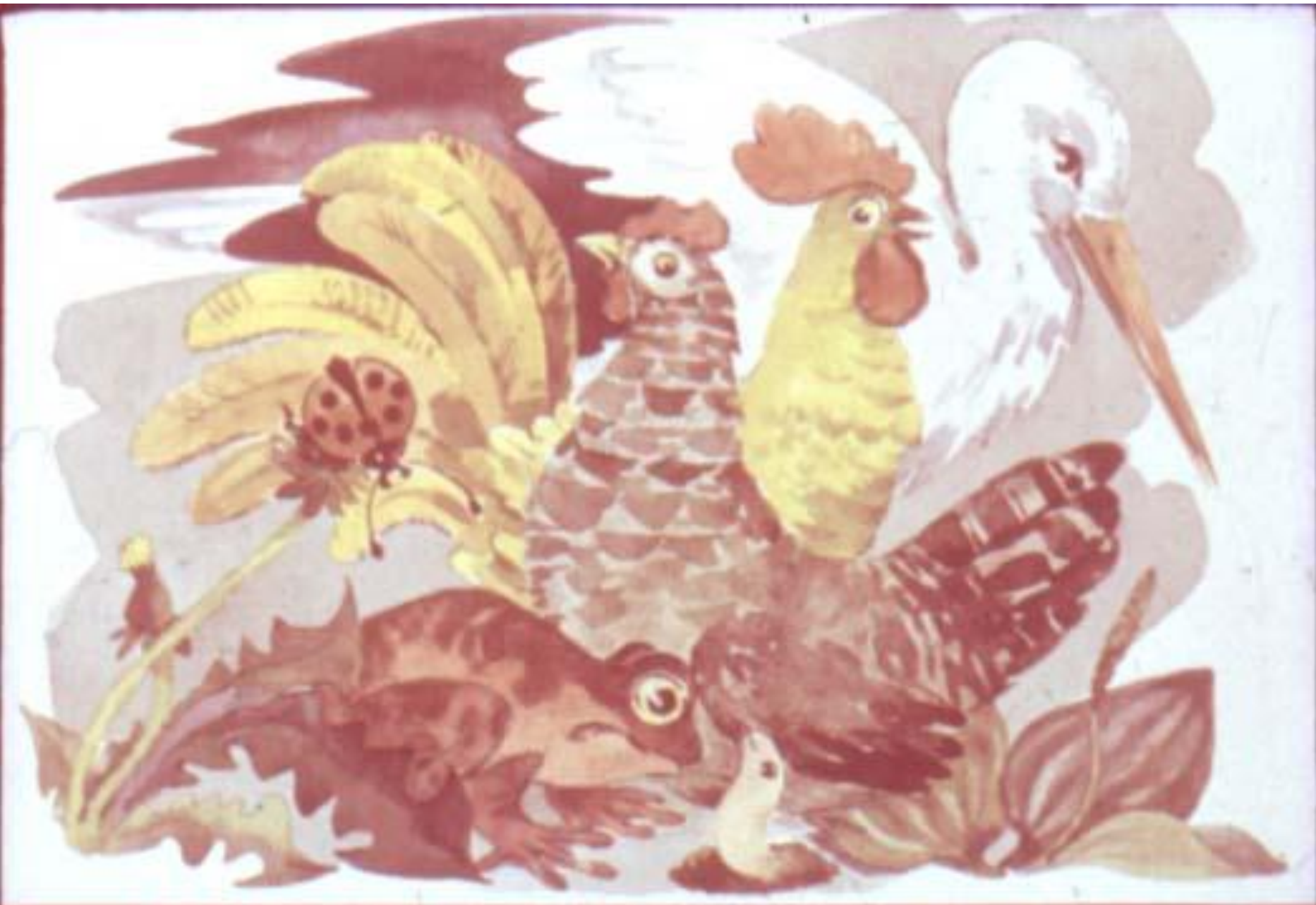
даже земляной червь высунул голову из-под земли... [9]