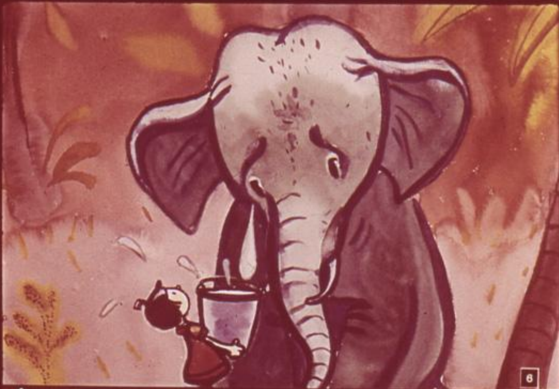
А слезищи огромные. Кап в ведро, и сразу ведро полное.