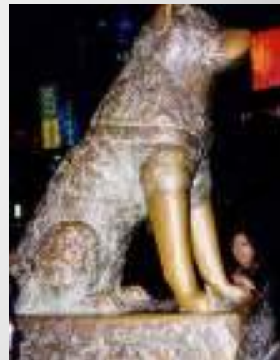
Памятник собаке-поводырю в Берлине.