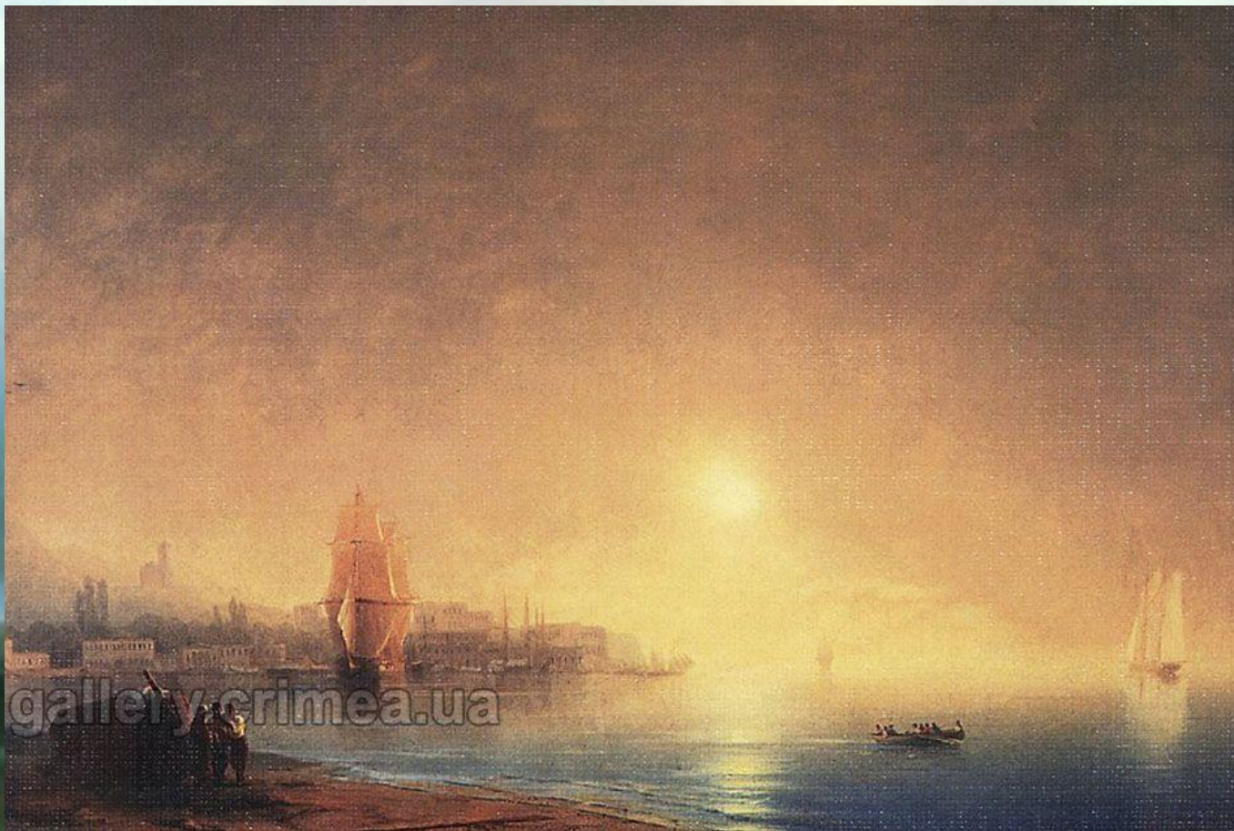
Утро на берегу залива «Ялта»