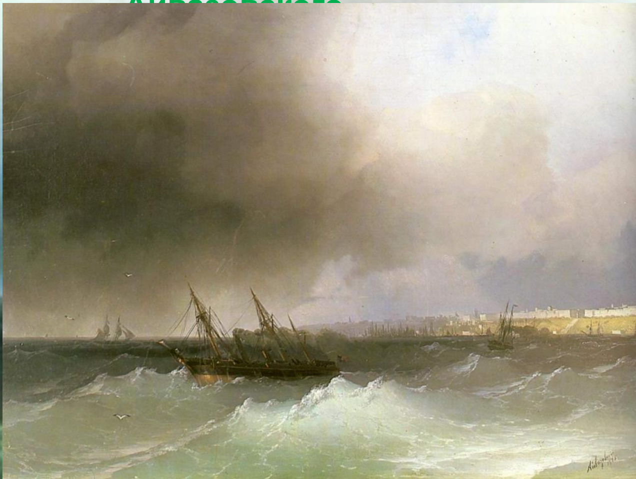
Вид Одессы с моря