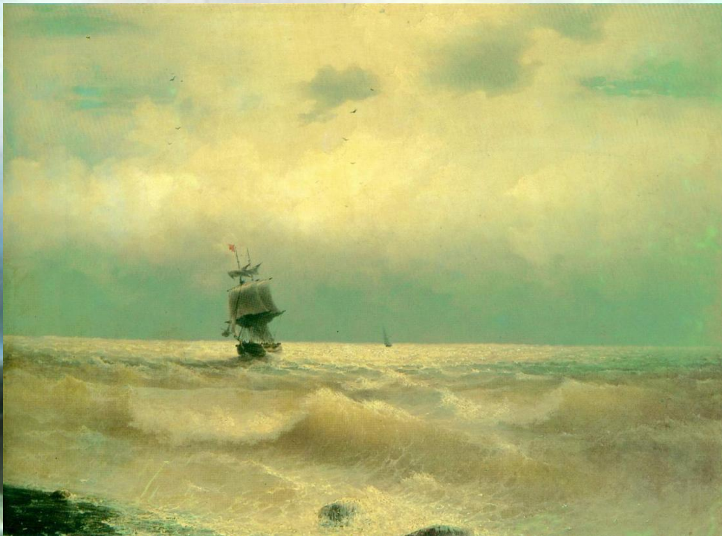
Корабль у берега