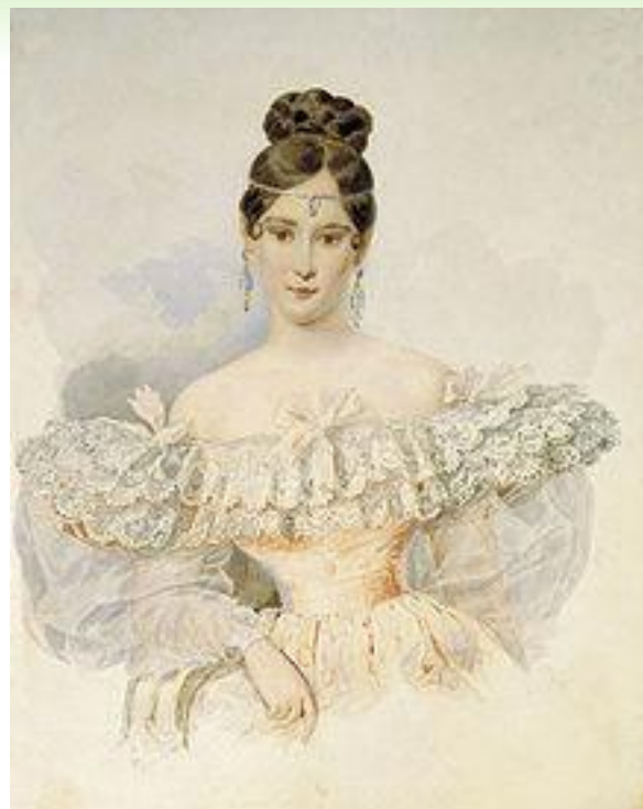
Наталья Николаевна Гончарова