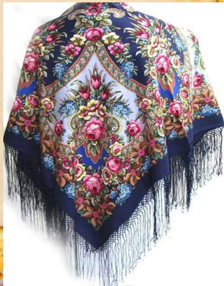
Шали Павловского Посада