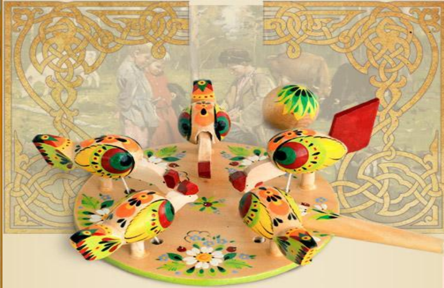
Резная игрушка – Богородская