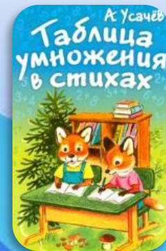
Таблица умножения на 7 в стихах А. Усачёв